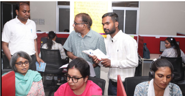
दिया गया। श्रीमती वृष्णि ने इन मामलों में नियमानुसार सख्त कार्रवाई करने के निर्देश दिए। वहीं राजपुरा गांव में चारागाह भूमि पर बजरी के अवैध खनन

से 90.89 प्रतिशत शिकायतों का सफलतापूर्वक निस्तारण किया जा चुका है। विशिष्ट शासन सचिव ने अधिकारियों को निर्देश दिए कि जिन शिकायतों को परिवारियों ने 'नॉट सैटिस्फाइड' श्रेणी में दर्ज किया है, उनमें शिकायतकर्ताओं से सीधे फोन पर संपर्क कर समस्या की वास्तविक स्थिति समझी जाए और प्रभावी समाधान सुनिश्चित किया जाए। निरीक्षण के दौरान अजमेर जिले के भिनाय ब्लॉक और बडली क्षेत्र में अवैध खनिज परिवहन से जुड़ी शिकायतों पर विशेष ध्यान