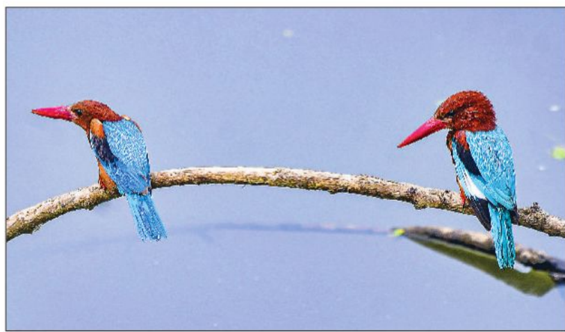
असम के गनांग जिले में मंगलवार को एक पेड़ की टहनियों पर दो भूरे गले वाले किंगफिशर बैठे दिखे।