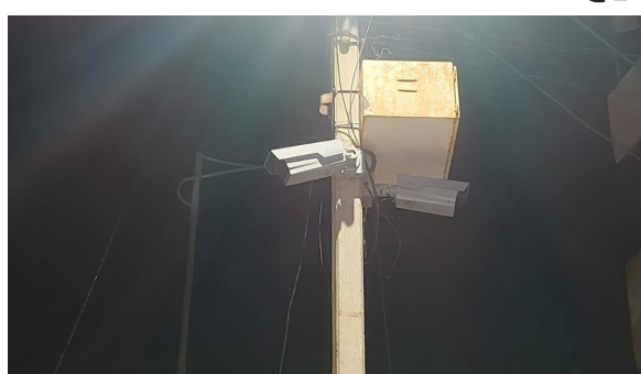
के खुलासे में पुलिस को महत्वपूर्ण सक्षय उपलब्ध हो सकेगी। कैमरों की निगरानी और कंट्रोल सिस्टम मनोहरपुर थाना में पुलिस के नियंत्रण में रहेगा, जिससे सुरक्षा व्यवस्था और अधिक प्रभावी बन सकेगी। नगर पालिका का मानना है कि आधुनिक तकनीक से लैस निगरानी व्यवस्था न केवल अपराधों पर अंकुश लगाने में सहायक होगी, बल्कि आम नागरिकों में भी सुरक्षा का भरोसा