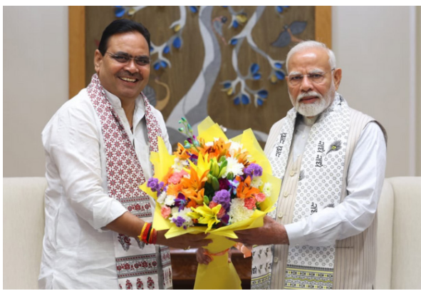
एचपीसीएल राजस्थान रिफाइनरी जैसी महत्वपूर्ण परियोजनाओं ने प्रदेश के विकास को नई दिशा दी है। रिफाइनरी के शुरू होने से प्रदेश में औद्योगिक और आर्थिक विकास का नया दौर प्रारंभ

शक्ति वंदन, युवा सशक्तिकरण और सांस्कृतिक विरासत के संरक्षण जैसे क्षेत्रों में ऐतिहासिक कार्य हुए हैं। इन प्रयासों से देश के 140 करोड़ नागरिकों में 'मोदी है तो मुमकिन है' का विश्वास और अधिक मजबूत हुआ है। मुख्यमंत्री ने कहा कि प्रधानमंत्री के मार्गदर्शन में राजस्थान विकास के नए आयाम स्थापित कर रहा है। उन्होंने उल्लेख किया कि राम जल सेतु लिंक परियोजना, यमुना जल समझौता, जयपुर मेट्रो फेज-2, माही-बांसवाड़ा परमाणु ऊर्जा परियोजना और