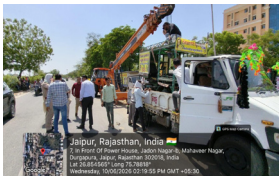
अपार्टमेंट विद्याधर नगर, मणीपाल हॉस्पिटल के पीछे विद्याधर नगर, झोटवाड़ा पुलिया के नीचे एवं बजरंग कॉलोनी के बाहर झोटवाड़ा आदि स्थानों से अस्थाई अतिक्रमण करने वालों के विरुद्ध 19 हजार 500 रुपये का कैरिंग चार्ज वसूल किया गया तथा दौरे के दौरान कार्यवाही सतर्कता टीम द्वारा मौके पर समझाइश करते हुए मौखिक पाबंद करवाया कि भविष्य में अस्थाई अतिक्रमण समय से हटा ले अस्था नगर निगम जयपुर के क्षेत्राधिकार में अवैध अतिक्रमण करने वालों के विरुद्ध भारी चालान या प्रभावी कार्रवाई अमल में लाई जायेगी।