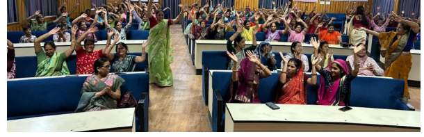
आयोजन किया गया। इस अवसर पर नुक्कड़ नाटक, सांस्कृतिक प्रस्तुतियों एवं सूचना आधारित कार्यक्रमों के माध्यम से महिलाओं को जागरूक किया गया। साथ ही महिला संरक्षण एवं सुरक्षा से संबंधित कानूनी प्रावधानों तथा महिलाओं के लिए संचालित विभिन्न सहायता केन्द्रों एवं सेवाओं की जानकारी भी प्रदान की गई। कार्यक्रम में जिला स्तर पर 310 प्रतिभागियों ने सहभागिता की, जबकि जिले के समस्त ब्लॉक स्तरीय कार्यक्रमों में 1,622 से अधिक प्रतिभागियों ने भाग लिया। इस दौरान लाडो प्रोत्साहन योजना के लाभार्थियों को प्रतीकात्मक

जयपुर (रॉयल पत्रिका)। महिलाओं के नेतृत्व एवं निर्णय क्षमता को बढ़ावा देने, राजकीय योजनाओं एवं सेवाओं की पहुंच सुनिश्चित करने तथा सामाजिक एवं आर्थिक सशक्तिकरण को प्रोत्साहित करने के उद्देश्य से बुधवार को जयपुर जिले में जिला एवं ब्लॉक स्तर पर नारी चौपाल-नारी शक्ति वंदन कार्यक्रम का आयोजन किया गया। जिला स्तरीय कार्यक्रम का आयोजन जिला परिषद सभागार, जयपुर में किया गया। कार्यक्रम के दौरान चिकित्सा, स्वास्थ्य एवं परिवार कल्याण विभाग, ग्रामीण विकास विभाग तथा सामाजिक न्याय एवं अधिकारिता विभाग द्वारा संचालित महिला केन्द्रित योजनाओं एवं सेवाओं पर संवाद आयोजित किया गया। साथ ही बाल विवाह रोकथाम, साइबर सुरक्षा, एनीमिया नियंत्रण, लिंगानुपात सुधार तथा सर्वाधिकल कैंसर की रोकथाम जैसे महत्वपूर्ण विषयों पर जागरूकता गतिविधियों का