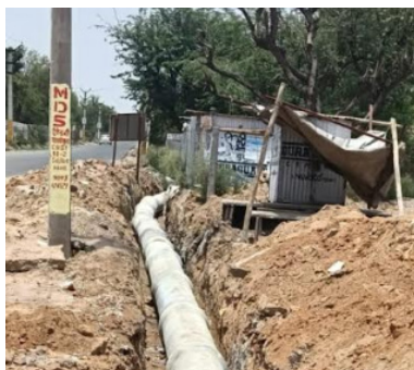
कराया। नगर पालिका द्वारा पानी निकासी के लिए खुदाई कर सीमेंटेड पाइप डाले गए तथा जमा पानी को धूलेश्वर कॉलेज के सामने बनी

मनोहरपुर (रॉयल पत्रिका)। मनोहरपुर क्षेत्र के हंसराज तिराहा-बिशनगढ़ तिराहा मार्ग पर स्थित कई कॉलोनीयों का पानी निकासी व्यवस्था नहीं होने के कारण लंबे समय से सड़कों पर जमा हो रहा था। जलभराव की समस्या से स्थानीय व्यापारियों, राहगीरों और वाहन चालकों को भारी परेशानियों का सामना करना पड़ रहा था। इस गंभीर समस्या को लेकर एलएनएस न्यूज चैनल एवं जयपुर ग्रामीण चैनल के माध्यम से प्रमुखता से समाचार प्रकाशित किया गया। खबर प्रकाशित होने के बाद नगर पालिका प्रशासन की दिशा में महत्वपूर्ण कार्य शुरू