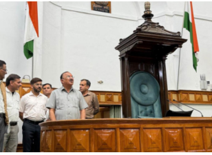
देवनाजी ने सन 1850 में निर्मित हेरिटेज महल वायसराय लॉज का भी भ्रमण किया। यह भव्य धरोहर भवन ब्रिटिश शासनकाल में भारत के वायसराय के ग्रीष्मकालीन निवास के रूप में उपयोग में लाया जाता था। लगभग 151 एकड़ परिसर में फैला यह भवन अपनी विशिष्ट वास्तुकला, विशाल उद्यानों एवं हिमालय के मनोरम दृश्यों के लिए प्रसिद्ध है। वर्ष 1965 में तत्कालीन राष्ट्रपति डॉ. सर्वपल्ली राधाकृष्णन ने इसे अधिकारिक राष्ट्र पति रिट्रीट घोषित किया। देवनाजी ने इण्डियन इस्टी ट्यूट ऑफ एडवांस स्टडीज का भी अवलोकन किया। देवनाजी ने कहा कि हिमाचल प्रदेश की ऐतिहासिक धरोहरें, प्राकृतिक संपदा, अध्यात्मिक आस्था केंद्र एवं सांस्कृतिक विरासत भारत की समृद्ध परंपराओं को सशक्त रूप से प्रतिबिंबित करती हैं। इन स्थलों का संरक्षण एवं संवर्धन देश की सांस्कृतिक चेतना को सुदृढ़ बनाने में महत्वपूर्ण भूमिका निभाता है।

जयपुर (रॉयल पत्रिका)। राजस्थान विधानसभा अध्यक्ष वासुदेव देवनाजी ने हिमाचल प्रदेश प्रवास के दौरान शिमला एवं आसपास के विभिन्न ऐतिहासिक, शैक्षणिक, सांस्कृतिक तथा प्राकृतिक महत्व के स्थलों का अवलोकन कर उनकी विशेषताओं की जानकारी प्राप्त की। प्रवास के दौरान देवनाजी ने हिमाचल प्रदेश विधानसभा भवन का अवलोकन किया तथा वहां की संसदीय परंपराओं, कार्यप्रणाली एवं विधानसभा परिसर की ऐतिहासिक पृष्ठभूमि की जानकारी प्राप्त की। उन्होंने विधानसभा परिसर में उपलब्ध विभिन्न सुविधाओं एवं व्यवस्थाओं का भी निरीक्षण किया। इसके उपरांत उन्होंने शिमला की सबसे ऊंची पहाड़ी पर स्थित प्रसिद्ध जाखू हनुमान मंदिर में दर्शन कर पूजा-अर्चना की। आध्यात्मिक आस्था का यह प्रमुख केंद्र अपनी विशाल हनुमान प्रतिमा एवं प्राकृतिक सौंदर्य के लिए देशभर में प्रसिद्ध है। स्पीकिर देवनाजी ने शिमला के ऐतिहासिक मॉल रोड का अवलोकन किया। उन्होंने यहां स्थित विभिन्न ऐतिहासिक भवनों एवं सांस्कृतिक स्थलों की जानकारी प्राप्त की। स्पीकर