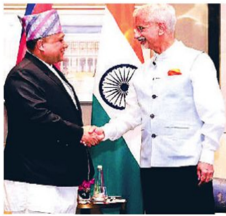
उत्साह के साथ हुई मुलाकात

◀ दोनों पक्ष संबंधों को नई ऊंचाइयों पर ले जाने पर सहमत ◀ ऊर्जा, शिक्षा, स्वास्थ्य, संस्कृति से लेकर खेल पर भी चर्चा