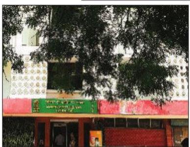
पेट्रोलियम और प्राकृतिक गैस मंत्रालय नई दिल्ली

सरकार ने बताया कि फरवरी 2026 में सऊदी कॉन्ट्रैक्ट प्राइस करीब 543 डॉलर प्रति टन थी, लेकिन पश्चिम एशिया संकट और होर्मुज मार्ग पर असर पड़ने के बाद यह बढ़कर जून में करीब 790 डॉलर प्रति टन पहुंच गई। यानी चार महीनों में करीब 46 प्रतिशत की बढ़ोतरी हुई। इसी वजह से गैस कंपनियों की लागत बढ़ी और सिलेंडर महंगा करना पड़ा।