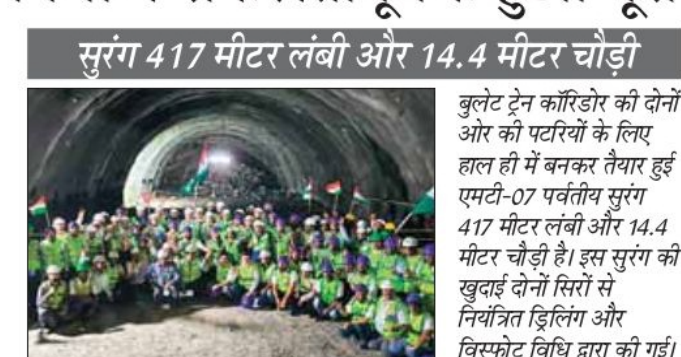
बुलेट ट्रेन कॉरिडोर की दोनों ओर की पटरियों के लिए हाल ही में बनकर तैयार हुई एमटी-07 पर्वतीय सुरंग 417 मीटर लंबी और 14.4 मीटर चौड़ी है। इस सुरंग की खुदाई दोनों सिरों से नियंत्रित ड्रिलिंग और विस्फोट विधि द्वारा की गई।