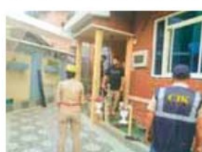
सीआईके श्रीनगर में एफआईआर दर्ज होने के बाद ये तलाशी अभियान चलाया गया। जांच में पता चला है कि संधिध, पाकिस्तान स्थित आतंकवादी हैंडलर्स के साथ एफ़्टएड संचार प्लेटफॉर्म के माध्यम से संपर्क में थे और आतंकी गतिविधियों में सहयोग कर रहे थे।

जम्मू और कश्मीर पुलिस की काउंटर इंटेलिजेंस कश्मीर शाखा ने आतंकवाद से संबंधित मामलों के सिलसिले में घाटी भर में कई स्थानों पर छापेमारी की। काउंटर इंटेलिजेंस कश्मीर (सीआईके) ने पाकिस्तान प्रायोजित आतंकवादी नेटवर्क, स्लीपर सेल और भर्ती, कट्टरता और आतंकवाद को बढ़ावा देने से संबंधित गतिविधियों की चल रही जांच के सिलसिले में केंद्र शासित प्रदेश के 6 जिलों में 8 स्थानों पर तलाशी शुरू की है। पुलिस स्टेशन