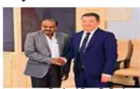
कुमारस्वामी और बैकिट सिडिकोव

भारत-किर्गिस्तान के बीच आर्थिक सहयोग को मजबूत करने के उद्देश्य से राजधानी विश्केक में महत्वपूर्ण बैठक आयोजित की गई। बैठक में भारत की ओर से वरिष्ठ प्रतिनिधियों और किर्गिस्तान सरकार के अर्थव्यवस्था एवं वाणिज्य मंत्री बैकिट सिडिकोव के बीच व्यापार, उद्योग और निवेश से जुड़े विभिन्न मुद्दों पर विस्तृत चर्चा हुई। भारतीय प्रतिनिधिमंडल का नेतृत्व कर रहे एच.डी. कुमारस्वामी ने कहा कि दोनों देशों के बीच आर्थिक साझेदारी