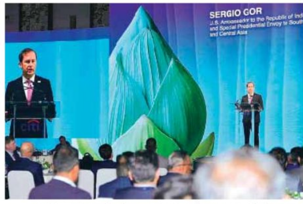
मुंबई में कार्यक्रम को संबोधित करते अमेरिकी राजदूत सर्जियो गोर

आपसी निवेश से रोजगार और उद्योगों को लाभ होगा