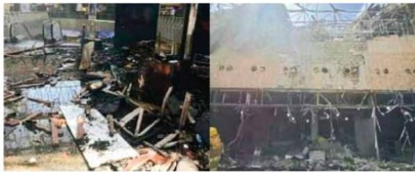
ईरानी हमले में क्षतिग्रस्त कुवैत का हवाई अड्डा

कुवैत की चेतावनी: नागरिकों की सुरक्षा सर्वोपरि, हमला बर्दाश्त नहीं