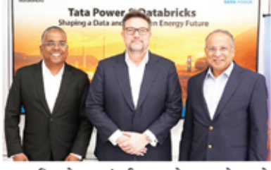
नए बिजनेस-कंपनी अपने अगले बड़े बदलाव के लिए एक प्यूचर-रेडी डेटा और एआई प्लेटफॉर्म तैयार कर रही है। यह प्लेटफॉर्म बिजली ग्रिड को स्मार्ट बनाएगा, रिन्यूएबल ऊर्जा (जैसे सौर ऊर्जा) का सटीक

मुंबई, एप्रैल 11। भारत की एक प्रमुख एकीकृत बिजली कंपनी और टाटा समूह का हिस्सा, टाटा पावर ने अपने सभी बिजनेस क्लस्टर में डेटा और एआई परिवर्तन को गति देने के लिए डेटाब्रिक्स प्लेटफॉर्म को व्यापक रूप से अपनाने की घोषणा आज की है। इस रणनीतिक कदम का उद्देश्य परिचालन दक्षता को बढ़ाना, निर्णय लेने की प्रक्रिया को अधिक सटीक बनाना और डिजिटल नवाचार को नई ऊंचाइयों पर ले जाना है।