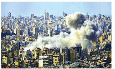
लेबनान के बेरुत के दक्षिणी उपनगर दहिह्येह में इजराइली हवाई हमलों से हुआ धुआं-धुआं