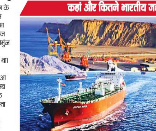
कहां और कितने भारतीय जहाज फंसे हैं?

जहाजराजी मंत्रालय के अनुसार, 16 भारतीय पोत फारस की खाड़ी में हैं, जो होर्मुज स्ट्रेट के पश्चिम में हैं। वहीं, चार जहाज ओमान की खाड़ी में हैं। इसके अलावा, एक जहाज अदन की खाड़ी में है। वहीं, 2 जहाज लाल सागर में हैं। फारस की खाड़ी में मौजूद जहाजों में से 5 जहाज मुवमैट कर रहे हैं। वहीं, शिपिंग कॉरपोरेशन ऑफ इंडिया के 5 जहाज हैं।