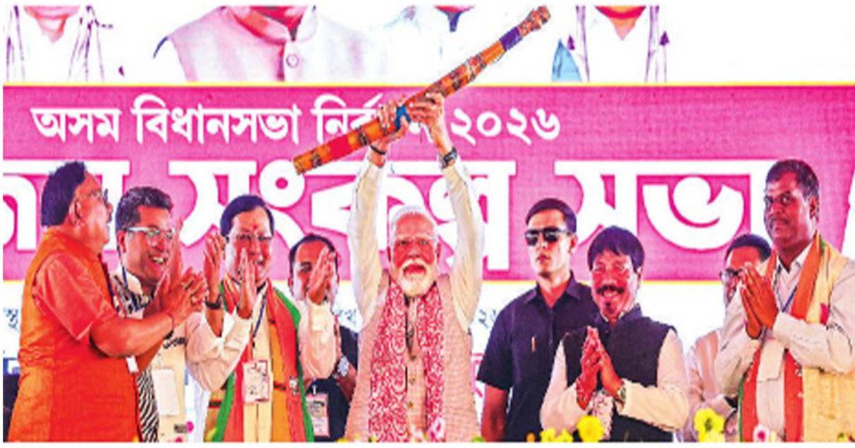
असम के डिब्रूगढ़ की एक विशाल जनसभा चुनावी रेली के दौरान भाजपा उम्मीदवारों के साथ मंच पर पीएम मोदी

जड़ दिल्ली प्रधानमंत्री नरेंद्र मोदी ने असम विधानसभा चुनाव प्रचार की अपनी मुहिम के तहत सोमवार को डिब्रूगढ़ में एक विशाल जनसभा को संबोधित करते हुए विपक्ष पर तीखा हमला बोला। मोदी ने कहा कि उन्हें डिब्रूगढ़ आने का कई बार अवसर मिला है, लेकिन इस बार जो जोश और उत्साह देखने को मिला, वह पहले कभी नहीं देखा। उन्होंने कहा कि वह जनसमर्थन कांग्रेस के लिए चिंता का विषय है और मतदान से पहले यह तयवैरी विपक्ष को परत कर देंगे। पीएम मोदी ने असम की सांस्कृतिक विविधता और एकता को सराहना करते हुए कहा कि यहां विभिन्न समुदाय-अहोम, कोच-राजवंशी, मोरान, मोतोह, मिर्सिंग, देवरी-सदियों से सौहार्द के साथ रहते आए हैं। उन्होंने कहा कि भाषा भले अलग हो, लेकिन सभी का सपना एक है-विकसित असम और विकसित भारत। पीएम