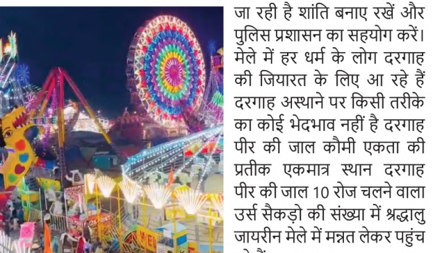
जा रही है शांति बनाए रखें और पुलिस प्रशासन का सहयोग करें। मेले में हर धर्म के लोग दरगाह की जियारत के लिए आ रहे हैं दरगाह अस्थाने पर किसी तरीके का कोई भेदभाव नहीं है दरगाह पीर की जाल कौमी एकता की प्रतीक एकमात्र स्थान दरगाह पीर की जाल 10 रोज चलने वाला उर्स सैकड़ों की संख्या में श्रद्धालु जायरीन मेले में मंत्रत लेकर पहुंच रहे हैं।