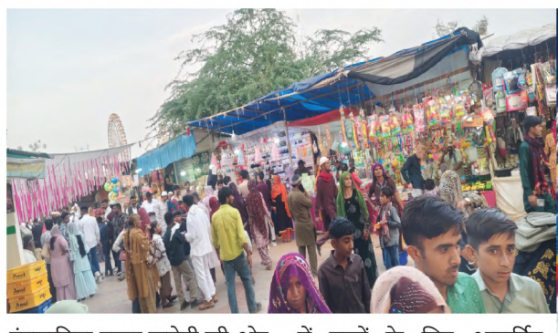
इंतजामिया वक्फ कमेटी की ओर से दोनों टाइम लंगर मुफ्त खाने की व्यवस्था की गई है उर्स मुबारक में हर रोज रात्रि में ईशा नमाज बाद उलमाए किराम के नूरानी बयानात का प्रोग्राम होता है बाद में गुजरात व राजस्थान के मशहूर मारूफ कव्वाल द्वारा कव्वाली का प्रोग्राम होता है। सालाना उर्स मुबारक में बच्चों के लिए आकर्षित झूला,मौत का कुआं,ब्रेक डांसर,मिकी माउस,डबल इंजन रेल,सर्कस,जादूगर,खिलौना,मनि हारी, मिठाइयां सहित कई प्रकार की दुकान लगी है उर्स मुबारक में हजारों की संख्या में पहुंच रहे जायरीनों से दरगाह इंतजामिया कमेटी की ओर से यह अपील की