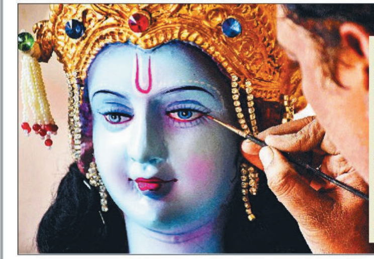
महाराष्ट्र के नागपुर में चल रहे नवरात्रि उत्सव के दौरान राम नवमी से पहले एक कलाकार भगवान राम की मूर्ति को अंतिम रूप दे रहा है।