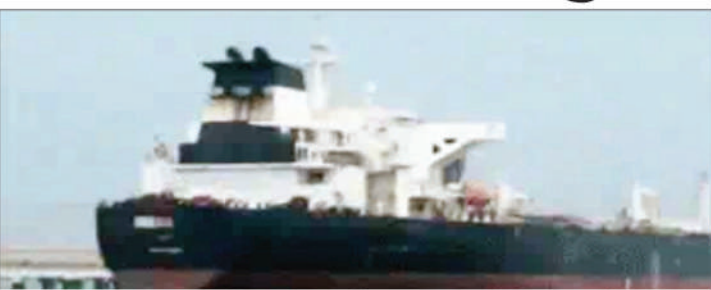
भारत और ईरान की 3 दिनों से हो रही थी चर्चा

नई दिल्ली (एजेंसी)। पश्चिम एशिया में बढ़ते तनाव के बीच सऊदी अरब से कच्चा तेल लेकर आया लाइबेरियाई ध्वज वाला टैंकर ईरान की अनुमति से होमर्ज जलडमरूमध्य पार कर सुरक्षित रूप से मुंबई पोर्ट पहुंच गया। भारत सरकार क्षेत्र में मौजूद भारतीय जहाजों और नाविकों की सुरक्षा पर लगातार नजर रखे हुए है। दो टैंकर आने के बाद क्या भारत के लिए होमर्ज को ईरान ने खोल दिया है।