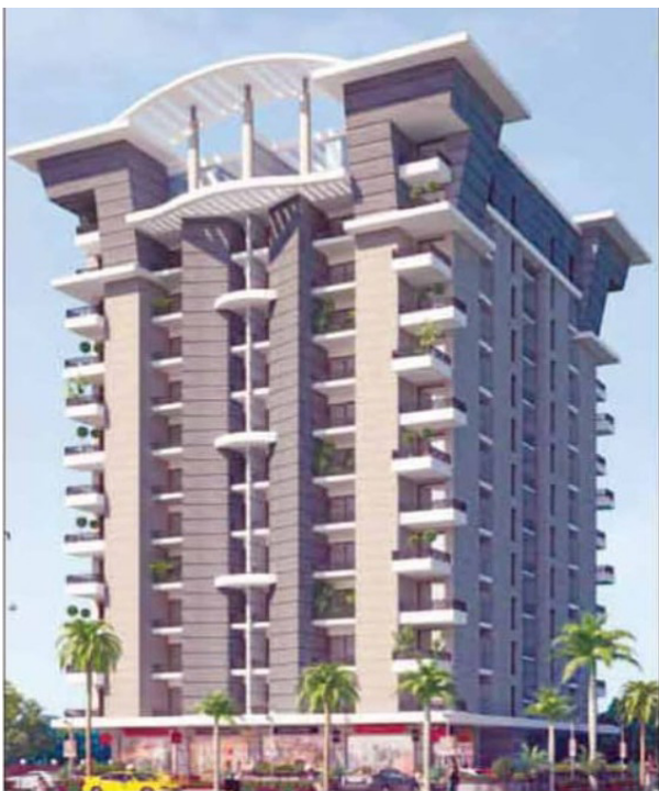
पर है। हाई लेवल की सुविधा होने के कारण इस अपार्टमेंट

जयपुर (रॉयल पत्रिका)। जयपुर शहर के आदर्श नगर में एमडी रोड स्थित मुस्लिम स्कूल के सामने शिव शीतल बिल्डर्स प्राइवेट लिमिटेड ने एक सर्व सुविधायुक्त अपार्टमेंट बनाया है जिसमें 4BHK सुपर लक्जरी फ्लैट बनाए गए हैं। इस पूरे अपार्टमेंट में 46 में से करीब 25 फ्लैट सेल हो चुके हैं। इस अपार्टमेंट को खास बात है कि पूरी बिल्डिंग की फिनिशिंग स्टोन क्लेडिंग से की गई है जिससे बिल्डिंग का तापमान कम रहता है एवं बिल्डिंग की लाइफ भी बढ़ जाती है। अपार्टमेंट में ग्राउंड फ्लोर पर आधुनिक जिम, स्टीम बाथ, सोना बाथ, जकूजी, छत पर स्वीमिंग पूल, पार्टी एरिया एवं शोरूम की सुविधा है। अपार्टमेंट से एयरपोर्ट 10 किमी. एवं रेलवे जंक्शन से 4 किलोमीटर की दूरी