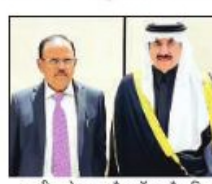
अजीत डोमाल और डॉ. मुसैद बिन मोहम्मद अल-एबन

भारत राष्ट्रीय सुरक्षा सलाहकार अजीत डोमाल सऊदी अरब के दौर पर हैं। डोमाल की यह यात्रा पश्चिम एशिया में तेजी से बदलते भू-राजनीतिक हालात के बीच हो रही है। डोमाल ने बुधवार को सऊदी अरब के विदेश राज्य मंत्री, कैबिनेट सदस्य और राष्ट्रीय सुरक्षा सलाहकार, डॉ. मुसैद बिन मोहम्मद अल-एबन के साथ मुलाकात की। मुलाकात के दौरान डोमाल ने डॉ. मुसाएद बिन मोहम्मद अल-एबन के साथ मुलाकात के दौरान द्विपक्षीय मुद्दों पर चर्चा की। बातचीत में द्विपक्षीय सहयोग के साथ-साथ क्षेत्रीय और आपसी हित के अन्य मुद्दों पर भी चर्चा हुई।