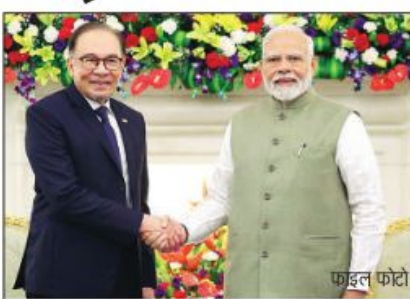
मलेशियाई पीएम दातो सेरी अनवर इब्राहिम और पीएम नरेंद्र मोदी पीएम की आगामी यात्रा दोनों नेताओं के लिए व्यापार और निवेश, रक्षा, सुरक्षा और समुद्री सहयोग से लेकर डिजिटल और वित्तीय प्रौद्योगिकी, ऊर्जा, स्वास्थ्य सेवा, शिक्षा, संस्कृति, पर्यटन के संपूर्ण दायरे की समीक्षा होंगी।

पीएम मोदी 7-8 फरवरी को मलेशिया की आधिकारिक यात्रा पर जाएंगे। इस दौरान वह मलेशिया के पीएम के साथ कई महत्वपूर्ण मुद्दों पर बातचीत करेंगे। भारतीय विदेश मंत्रालय के अनुसार पीएम मोदी को मलेशिया के पीएम दातो सेरी अनवर इब्राहिम ने आमंत्रित किया है। यह पीएम मोदी की मलेशिया की तीसरी यात्रा होगी और अगस्त 2024 में भारत-मलेशिया द्विपक्षीय संबंधों को 'व्यापक रणनीतिक साझेदारी' का दर्जा दिए जाने के बाद पहली यात्रा होगी। इस यात्रा के दौरान वे पीएम अनवर इब्राहिम के साथ द्विपक्षीय चर्चा करेंगे। पीएम भारतीय समुदाय के सदस्यों के साथ-साथ उद्योग और व्यापार प्रतिनिधियों से भी बातचीत करेंगे। पीएम की यात्रा के साथ ही 10वां भारत-मलेशिया सीईओ फोरम भी आयोजित किया जाएगा।