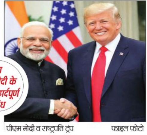
पीएम मोदी व राष्ट्रपति ट्रंप

कैरोलिन लेविट ने कहा कि भारत ने न सिर्फ रूस से तेल खरीदना बंद करने की प्रतिबद्धता जताई है, बल्कि अमेरिका से तेल खरीदने की भी प्रतिबद्धता जताई है, और संभवतः वेनेजुएला से भी, जिसका सीधा लाभ अब अमेरिका और अमेरिकी जनता को मिलेगा