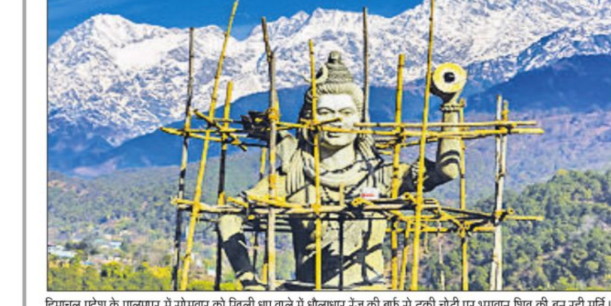
हिमाचल प्रदेश के पालमपुर में सोभार को खिली घुम वाले में धोलाधार रेंज की बर्फ से ढकी चोटी पर भगवान शिव की बन रही मूर्ति।