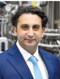
है। यह रिस्क 31 मार्च 2026 तक पूरा होने की उम्मीद है, जिसके बाद टीम की ओनरशिप में बदलाव हो सकता है। आईपीएल की दूसरी सबसे महंगी टीम थी - आरसीबी साल 2008 में जब आईपीएल की शुरुआत हुई थी, तब आरसीबी लीग की दूसरी सबसे महंगी टीम थी। उस समय इसे 111.6 मिलियन डॉलर (करीब 450 करोड़ रुपए तब के हिसाब से) में खरीदा गया था। पिछले कुछ सालों में टीम की ब्रांड वैल्यू और लोकप्रियता में भारी इजाफा हुआ है, जिससे अब इसकी कीमत कई हजार करोड़ रुपए होने का अनुमान है।

एक शानदार इन्वेस्टमेंट साबित हो सकती है। डियाजियो कर रही है टीम का 'स्ट्रैटेजिक रिस्क' - आरसीबी का मालिकाना हक फ्लिपहाल शराब बनाने वाली दिग्गज मल्टीनेशनल कंपनी 'डियाजियो' के पास है। डियाजियो ने मार्केट रेगुलेटर सेबी को दी गई जानकारी में बताया है कि वह रॉयल चैलेंजर्स स्पोर्ट्स प्राइवेट लिमिटेड में अपने निवेश का 'स्ट्रैटेजिक रिस्क' कर रही है। आरसीबीआईपीएल ही वह मूल कंपनी है जो आरसीबी की पुरुष और महिला दोनों टीमों का संचालन करती