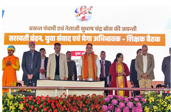
बसंत पंचमी एवं नेताजी सुभाष चंद्र बोस की जयन्ती सरस्वती वंदना, युवा संवाद एवं मेगा अभिभावक - शिक्षक बैठक स्टार्टअप को करीब साढ़े 22 करोड़ रुपये की सहायता जैसे निर्णय लिए गए हैं। मेगा पीटीएम के माध्यम से राजस्थान के शिक्षा क्षेत्र को मिलेगी नई दिशा- मुख्यमंत्री ने कहा कि शिक्षा व्यवस्था को बेहतर बनाने के लिए हमारी सरकार निरंतर नई नीतियों, योजनाओं और नवाचारों पर कार्य कर रही है। मेगा पीटीएम के माध्यम से

कहा कि सुभाष चंद्र बोस ने आजाद हिन्द फौज की स्थापना कर देश की आजादी में योगदान दिया। युवाओं का सशक्तीकरण राज्य सरकार की प्राथमिकता- मुख्यमंत्री ने कहा कि राज्य सरकार युवाओं की शिक्षा, कौशल विकास, रोजगार और स्वरोजगार के लिए अनेक तरह के प्रोत्साहन दे रही है। 1 लाख से अधिक पदों पर नियुक्तियां प्रदान की गई हैं और विभिन्न संवर्गों के 1 लाख 43 हजार पदों पर भर्ती प्रक्रियाधीन हैं और एक लाख सरकारी पदों की भर्ती परीक्षा का कैलेंडर जारी किया गया है। निजी क्षेत्र में करीब 1.5 लाख युवाओं को रोजगार मिला है। उन्होंने कहा कि प्रदेश में 71 नए राजकीय महाविद्यालयों की स्थापना, संभाग स्तर पर युवा साथी केंद्र की स्थापना, खेलो इंडिया यूनिवर्सिटी गेम्स का आयोजन जैसे कार्य किए गए हैं। साथ ही, युवाओं के सर्वांगीण विकास के लिए राजस्थान युवा नीति, मुख्यमंत्री युवा स्वरोजगार योजना, युवाओं को कौशल प्रशिक्षण तथा इंटरशिप, 65 आई-स्टार्टअप लॉन्चनेट नेस्ट स्थापना, 658