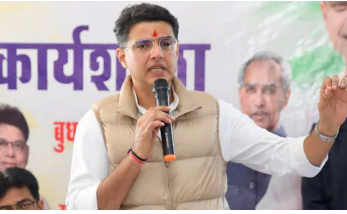
असहमति की सजा दी जा रही: सचिन पायलट

जयपुर। प्रयागराज माघ मेले में बीते पांच दिनों से धरने पर बैठे शंकराचार्य स्वामी अविमुक्तेश्वरानंद के समर्थन में अब सियासत भी गर्मा गई है। कांग्रेस महासचिव और राजस्थान के पूर्व उपमुख्यमंत्री सचिन पायलट टोंक से खुलकर उनके समर्थन में सामने आए हैं, जिससे यह मामला राजनीतिक रूप से और अहम हो गया है। सचिन पायलट ने कहा कि शंकराचार्य के खिलाफ ताबड़तोड़ कार्रवाई कर्तव्य उचित नहीं है। उन्होंने यह बयान राजस्थान के टोंक जिले में मीडिया से बात करते हुए दिया है। बीजेपी की राजनीति से