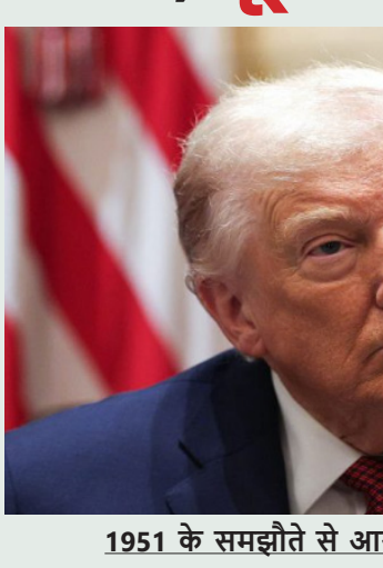
1951 के समझौते से आगे बढ़ेगी सुरक्षा, रूस-

राज्य अमेरिका और सभी नाटो देशों के लिए बहुत अच्छा होगा। इसी समझ के आधार पर मैं पहली फरवरी से लागू होने वाले टैरिफ नहीं लगाऊंगा।" ट्रंप ने यह बात नाटो महासचिव के साथ बैठक के बाद अपने दूध सोशल पोस्ट में कही। सीएनबीसी को दिए इंटरव्यू में ट्रंप ने कहा कि अमेरिका और नाटो देशों के बीच एक व्यापक समझ का ढांचा तैयार हो चुका है। उन्होंने कहा, "हम आर्कटिक और ग्रीनलैंड के मुद्दे पर एक साथ काम करेंगे। इसका संबंध मजबूत सुरक्षा व्यवस्था और साझा हितों से है।" ट्रंप ने इसे अमेरिका और यूरोपीय साझेदारों, दोनों के लिए फायदेमंद सौदा बताया।