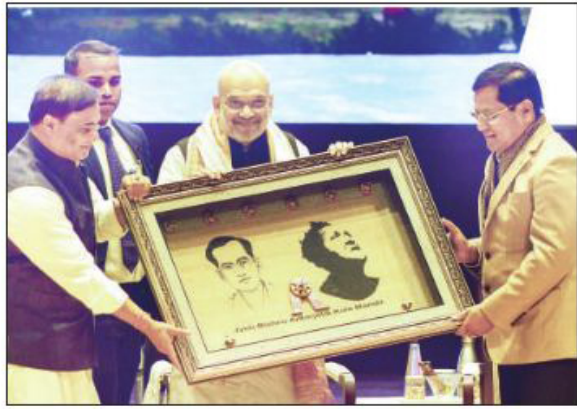
अमित शाह ने 'ज्योति-बिष्णु अंतर्जातिक कला मंदिर' का उद्घाटन किया