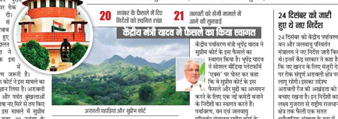
अरावली पहाड़ियां और सुप्रीम कोर्ट

सोमवार को अवकाश पीठ में हुई सुनवाई के दौरान सुप्रीम कोर्ट ने संबंधित क्षेत्र के विशेषज्ञों को मिलाकर एक उच्चस्तरीय समिति गठित करने का प्रस्ताव भी रखा। सुप्रीम कोर्ट ने केंद्र और अन्य पक्षों को नोटिस जारी करते हुए कहा कि इस मामले में आगे की सुनवाई 21 जनवरी को होगी