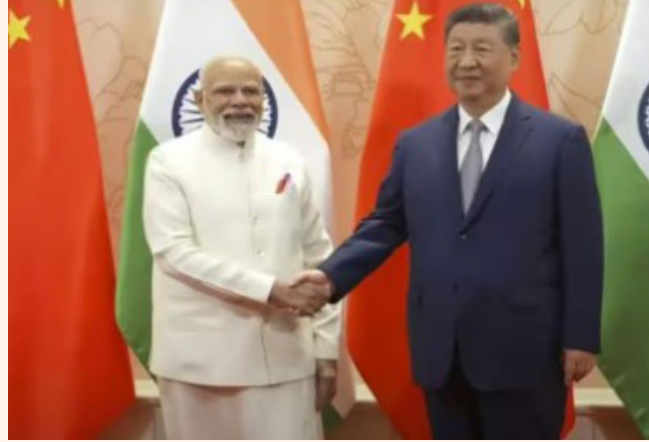
करने, आपसी भरोसा बढ़ाने और द्विपक्षीय संबंधों को स्थिर, स्वस्थ और टिकाऊ विकास की दिशा में आगे ले जाने के लिए तैयार है। यह बयान

चीनी विदेश मंत्रालय के मुताबिक, चीन भारत के साथ संवाद को मजबूत