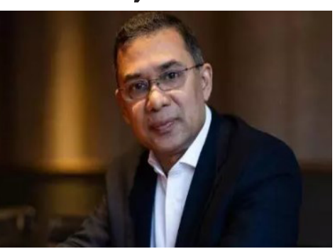
के बेटे हैं। वे वर्ष 2008 से लंदन में रहकर बीएनपी का

भारत के प्रधानमंत्री नरेंद्र मोदी ने बीमार खालिदा जिया की सेहत को लेकर चिंता जताई थी, जिस पर बीएनपी ने आभार प्रकट किया। लंबे समय बाद दोनों पक्षों के बीच इसे एक सकारात्मक संकेत के रूप में देखा जा रहा है। कहा जा रहा है कि तारिक रहमान जुलाई एक्सप्रेसवे के रास्ते स्वागत स्थल तक जाएंगे, जहां वे पार्टी कार्यकर्ताओं को संबोधित करेंगे। इसके बाद वे एवरकेपर अस्पताल जाकर अपनी बीमार मां और पूर्व प्रधानमंत्री खालिदा जिया से मुलाकात करेंगे। फिर गुलशन-2 स्थित अपने आवास पहुंचेंगे। तारिक रहमान कौन है? तारिक रहमान बांग्लादेश के पूर्व राष्ट्रपति जियाउर रहमान