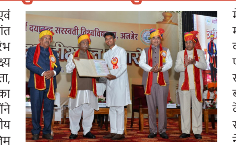
राज्यपाल ने अजमेर के ऐतिहासिक महत्व का उल्लेख करते हुए कहा कि अजमेर का प्राचीन नाम अजयमेरु रहा है। इसे चौहान शासक अजयराज ने बसाया था। उन्होंने महर्षि दयानंद सरस्वती को युगपुरुष बताते हुए कहा कि वेदों की ओर लौटो का उनका संदेश आज भी प्रासंगिक है। उन्होंने शिक्षा को व्यवहार से जोड़ने, चरित्र निर्माण, आत्मविकास, ब्रह्मचर्य, योग, प्राणायाम, वेद-उपनिषद तथा मातृभाषा और संस्कृत में अध्ययन की प्रेरणा दी। राज्यपाल ने कहा कि उपाधि प्राप्त विद्यार्थी राष्ट्र निर्माण में अपनी शिक्षा का उपयोग करें और प्रधानमंत्री नरेन्द्र मोदी के संकल्प के अनुरूप वर्ष 2047 तक भारत को विकसित राष्ट्र एवं विश्वगुरु बनाने में सक्रिय भूमिका निभाएं। उन्होंने विद्यार्थियों से राष्ट्र प्रथम की भावना के साथ आगे बढ़ने का आह्वान किया। उन्होंने विश्वविद्यालय परिसरों

जयपुर (रॉयल पत्रिका)। राज्यपाल एवं कुलाधिपति हरिभाऊ बागडे ने कहा कि दीक्षांत समारोह विद्यार्थियों के जीवन में एक नए आरंभ का प्रतीक है। उपाधि प्राप्त करना ही लक्ष्य नहीं होना चाहिए। इसके साथ बौद्धिक क्षमता, नैतिक मूल्यों और राष्ट्र के प्रति दायित्वबोध का विकास भी उतना ही आवश्यक है। उन्होंने कहा कि यह समावर्तन संस्कार प्राचीन भारतीय परंपरा से जुड़ा है। इसमें गुरु शिष्यों को अंतिम उपदेश देते थे। सत्य के मार्ग पर चलने, धर्म का आचरण करने और शिक्षा पर अहंकार नहीं करने की सीख देते थे। महर्षि दयानंद सरस्वती विश्वविद्यालय का त्रयोदश दीक्षांत समारोह गुरुवार को विश्वविद्यालय के सत्यार्थ सभागार में गरिमामय एवं भव्य वातावरण में आयोजित हुआ। समारोह की अध्यक्षता राज्यपाल एवं कुलाधिपति बागडे ने की। कार्यक्रम का शुभारंभ दीप प्रज्वलन एवं विश्वविद्यालय गीत के साथ हुआ। राज्यपाल एवं कुलाधिपति बागडे ने विभिन्न संकायों के 54 शोधार्थियों को विद्या वाचस्पति पीएचडी की उपाधि प्रदान की। साथ ही वर्ष 2020 से 2025 के मध्य उत्कृष्ट शैक्षणिक प्रदर्शन करने वाले 2 विद्यार्थियों को कुलाधिपति पदक तथा वर्ष 2023, 2024 एवं 2025 में सर्वाधिक अंक प्राप्त करने वाले 40 विद्यार्थियों को स्वर्ण पदक प्रदान कर सम्मानित