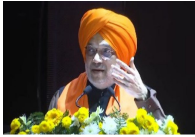
बारे में अवश्य जानना चाहिए। मुगल शासन का पतन भी गुरुओं के जीवनकाल में ही हुआ

गृह मंत्री अमित शाह ने कहा कि जब शहादत की चर्चा होती है, तो मन दुख, पीड़ा और शोक से भर जाता है, क्योंकि जिन बच्चों ने जीवन को ठीक से देखा भी नहीं था, वे शहीद हो गए। लेकिन इसके साथ ही गर्व भी होता है कि गुरु गोबिंद सिंह जी ने धर्म और देश की रक्षा के लिए अपने चारों साहिबजादों को न्योछावर कर दिया। इसी कारण गुरु गोबिंद सिंह जी को 'सरवंश दानी' कहा जाता है। उन्होंने कहा कि देश के युवाओं को गुरु गोबिंद सिंह जी और उनके साहिबजादों के जीवन एवं बलिदान के