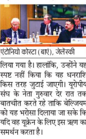
एंटोनियो कोस्टा (बाएं), जेलेस्की

एजेसी ब्रसेल्स यूरोपीय संघ के नेताओं ने शुक्रवार को यूक्रेन को अगले दो वर्षों में उसकी सैन्य और आर्थिक जरूरतों को पूरा करने के लिए एक बड़ा ब्याज-मुक्त ऋण देने पर सहमति जताई। यूरोपीय परिषद के अध्यक्ष एंटीोनियो कोस्टा ने कोस्टा ने सोशल मीडिया 'एक्स' पर एक पोस्ट में कहा कि ईयू और यूक्रेन के बीच समझौता हो गया है। 2026-27 के लिए यूक्रेन को 106 अरब डॉलर की सहायता देने का निर्णय मंजूर कर