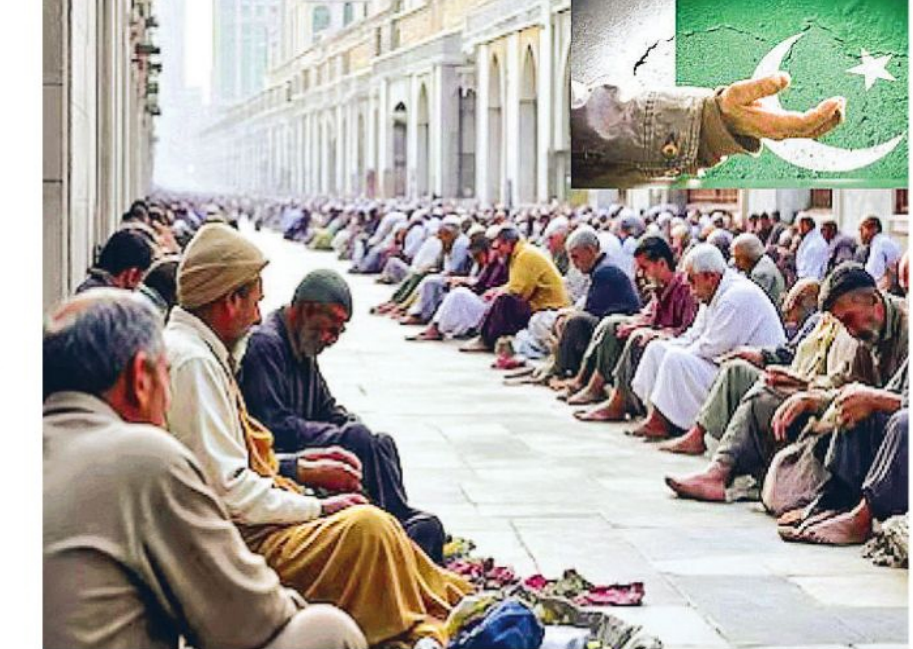
एफआईए ने पाक संसद में बताई सच्चाई

नई दिल्ली हज या उमराह जैसी इस्लाम की पवित्र धार्मिक यात्राओं के नाम पर विदेशों में जाकर भीख मांगने की इच्छा रखने वाले पाकिस्तानियों के लिए सऊदी अरब से एक बुरी खबर सामने आई है। जिसमें सऊदी सरकार ने उनके देश में भीख मांग रहे 56 हजार पाकिस्तान के लोगों को न केवल इंटरनेशनल बेइजली करतें हुए वापस भेज दिया है। बल्कि पाकिस्तान को सख्त चेतावनी देते हुए कहा है कि वो अपने देशों के लोगों को हज-उमराह वीजा का दुरुपयोग करने से रोके। जिससे वे मक्का-मदीना जैसे पवित्र शहरों में भीख मांगने के लिए न आ सकें।