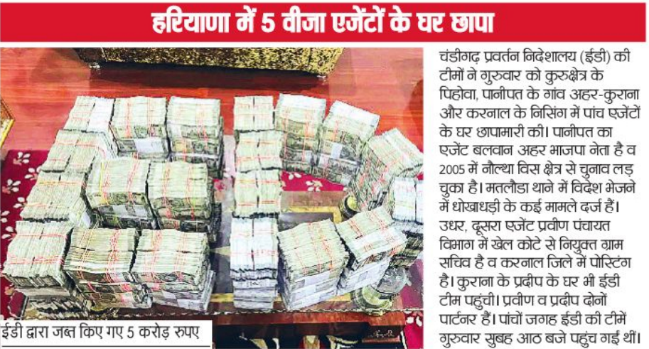
ईडी द्वारा जब्त किए गए 5 करोड़ रुपए

मोबाइल चैट डिजिटल सबूत बरामद हुए डंकी रूट की बातचीत दर्ज सभी डिजिटल डेटा और दस्तावेजों की फोरेंसिक जांच की जा रही