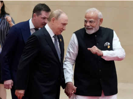
भारत और रूस की बढ़ती नजदीकी अमेरिका को रास नहीं आ रही है। रूस से कच्चा तेल खरीदने के चलते अमेरिकी राष्ट्रपति डोनाल्ड ट्रंप ने भारत पर 50 प्रतिशत टैरिफ लगाने का एलान किया था और इसे लेकर कई सख्त बयान भी दिए थे। हालांकि हाल के महीनों में ट्रंप के रुख में नरमी देखने को मिली है। टैरिफ के दबाव के बावजूद भारत अपने रुख पर कायम रहा और रूस के साथ अपने रणनीतिक संबंध बनाए रखे।