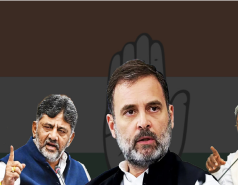
के समर्थन पर टिकी रही है। इस लिहाज से सिद्धारमैया को एक मजबूत और स्वीकार्य चेहरा माना जा रहा है, जो कांग्रेस की वैचारिक लाइन में भी अधिक फिट बैठते हैं। पार्टी की छवि को लेकर हाईकमान सतर्क डीके शिवकुमार के खिलाफ कई आपराधिक और भ्रष्टाचार से जुड़े मामलों दर्ज हैं। कांग्रेस हाईकमान को आशंका है कि यदि केंद्र सरकार के संकेत पर पुराने मामलों की फाइलें दोबारा खोली

कांग्रेस सांसद और लोकसभा में नेता प्रतिपक्ष राहुल गांधी लगातार जाति जनागणना और सामाजिक न्याय की बात करते रहे हैं। कांग्रेस की राजनीति परंपरागत रूप से दलितों, पिछड़ों और अल्पसंख्यकों