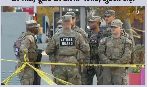
नई दिल्ली। अमेरिका के व्हाइट हाउस के नजदीक हुई गोलीबारी की घटना में बड़ा अपडेट सामने आया है। इस फायरिंग में घायल हुए दो नेशनल गार्ड जवानों में से एक ने इलाज के दौरान दम तोड़ दिया है, जबकि दूसरे जवान की हालत गंभीर बनी हुई है। डॉक्टरों की टीम उसका इलाज कर रही है। घटना के बाद पूरे इलाके में सुरक्षा व्यवस्था को और सख्त कर दिया गया है। हालात को देखते हुए राष्ट्रपति डोनाल्ड ट्रंप ने वॉशिंगटन डीसी में सुरक्षा बढ़ाने के लिए 500 अतिरिक्त सैनिकों की तैनाती के आदेश दिए हैं।