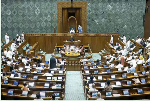
बदलावों को अहम माना जा रहा है।

सरकार इस शीतकालीन सत्र में परमाणु ऊर्जा, उच्च शिक्षा, कॉर्पोरेट कानून से जुड़े करीब 10 अहम विधेयक पारित कराने की योजना बना रही है। इनमें भारतीय उच्च शिक्षा आयोग से जुड़े प्रस्ताव और परमाणु ऊर्जा से संबंधित