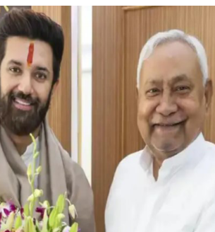
पासवान ने जो सपने देखे थे, आज वह पूरे हो रहे हैं।

ऑडियो कॉल पर चिराग पासवान ने कहा कि डॉक्टरों ने संक्रमण के खतरे को देखते हुए उन्हें बाहर जाने से मना किया है। उन्होंने कहा, 'हमारे पिता और पार्टी के संस्थापक स्वर्गीय रामविलास