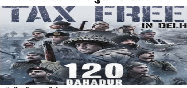
नई दिल्ली। अभिनेता फरहान अख्तर की फिल्म '120 बहादुर' 21 नवंबर को सिनेमाघरों में रिलीज हो गई थी। अब एक हफ्ते बाद फिल्म को दिल्ली में टैक्स फ्री कर दिया गया है। अपनी फिल्म को मिले इस रिस्पांस से फरहान अख्तर खुश हैं और उन्होंने दिल्ली की सीएम रेखा गुप्ता के इस फैसले पर खुशी जाहिर करते हुए आभार व्यक्त किया है। फरहान अख्तर ने इंस्टाग्राम पर '120 बहादुर' के टैक्स फ्री होने की जानकारी देते हुए पोस्ट किया है। फिल्म का पोस्टर शेयर कर उन्होंने लिखा, 'दिल्ली में अब '120 बहादुर' टैक्स फ्री हो गई है। दिल्ली की माननीय मुख्यमंत्री रेखा