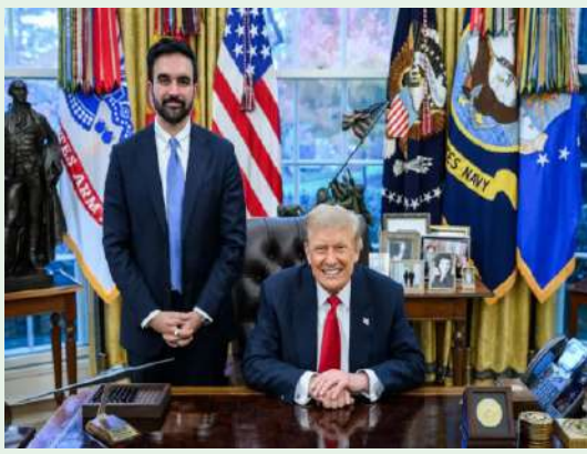
साथ मिलकर पत्रकार वार्ता की। पत्रकार वार्ता में राष्ट्रपति ने ज़ोहरान ममदानी की तारीफ की और न्यूयॉर्क के विकास के लिए योग्य लीडर बताया और साथ मिलकर काम करने

जयपुर (राज्यल पत्रिका)। अमेरिकी राष्ट्रपति डोनाल्ड ट्रंप और अमेरिका के न्यूयॉर्क शहर के मेयर ज़ोहरान ममदानी दोनों विपरीत विचारधारा के लिए जाने जाते हैं। न्यूयॉर्क मेयर चुनाव के समय अमेरिकी राष्ट्रपति डोनाल्ड ट्रंप ने ममदानी को वामपंथी मुस्लिम कहा गया और न्यूयॉर्क के जनता को ममदानी को मेयर चुनाव में हराने की अपील की और धमकाया भी कि यदि ममदानी चुनाव जीतता है तो न्यूयॉर्क की फंडिंग रोक दी जाएगी। इसी तरह चुनाव के दौरान ममदानी ने भी राष्ट्रपति ट्रंप को तानाशाह कहा और इजराइल का एक तरफा साथ देने की खुलकर आलोचना की। न्यूयॉर्क की जनता ने ममदानी को भारी बहुमत से जीताया। जीतने के बाद भारत जैसे देश में सोचा गया कि अब ममदानी के साथ अच्छा नहीं होने वाला है। लेकिन इसी बीच अमेरिकी डेमोक्रेसी की खूबसूरती एवं मजबूती तस्वीर सामने आई। राष्ट्रपति डोनाल्ड ट्रंप ने न्यूयॉर्क मेयर ज़ोहरान ममदानी को व्हाइट हाउस में मिलने बुलाया और