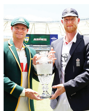
का ऐलान कर दिया है।

नई दिल्ली, एजेंसी। ऑस्ट्रेलिया और इंग्लैंड के बीच 5 टेस्ट मैचों की रोमांचक एशेज सीरीज का आगाज शुक्रवार से पर्थ में हो रहा है। फैंस सीरीज को लेकर बेहद रोमांचित हैं। क्रिकेट ऑस्ट्रेलिया के मुताबिक सभी पांच टेस्ट मैचों के पहले दिन के टिकट बिक गए हैं। क्रिकेट ऑस्ट्रेलिया के मुताबिक पर्थ टेस्ट के लिए, दूसरे और तीसरे दिन के टिकट तेजी से बिक रहे हैं, जबकि चौथे दिन के लिए अच्छी अवैलेबिलिटी है। दूसरा टेस्ट 4 दिसंबर से ब्रिस्बेन में खेला जाएगा। ब्रिस्बेन टेस्ट के पहले तीन दिन के टिकट बिक चुके हैं। चौथे दिन के टिकट तेजी से बिक रहे हैं। तीसरा टेस्ट 17 दिसंबर से एडिलेड में खेला जाएगा। तीसरे टेस्ट के पहले तीन दिन के टिकट भी बिक चुके हैं। चौथा टेस्ट मेलबर्न में 26 दिसंबर से खेला जाएगा। मेलबर्न टेस्ट के पहले दो दिनों के टिकट बिक चुके हैं। तीसरे दिन के लिए बहुत कम टिकट बचे हुए हैं। चौथे दिन के लिए भी टिकट बिक रहे हैं। पांचवां टेस्ट 4 जनवरी 2026 से सिडनी में खेला जाएगा। सिडनी टेस्ट के पहले चार दिनों के टिकट बिक चुके हैं। सभी पांच टेस्ट के लिए, पांचवें दिन के टिकट मैच की स्थिति के आधार पर दिए जाएंगे। पर्थ में होने वाले पहले टेस्ट के लिए ऑस्ट्रेलिया ने अपनी प्लेइंग इलेवन