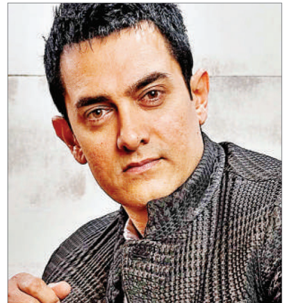
गए, लेकिन अब आमिर खान के एक न के बाद फिल्म ही बंद हो गई है।

थी- 'सितारे जमीन पर'। जिसे बॉक्स ऑफिस पर जबरदस्त रिस्पॉन्स मिला था पर अब हर किसी की निगाहें अगली ही फिल्म पर हैं। लेकिन अब तक वो किसी भी स्क्रिप्ट को फाइनल नहीं कर पाए हैं। लगातार कोशिशों के बाद भी आमिर खान के लिए मामला बन नहीं रहा। अब जिस फिल्म से उनकी हर किसी को उम्मीद थी, वो भी बंद हो गई है। आमिर खान के लिए उनका स्पेशल डायरेक्टर ही स्क्रिप्ट लिख रहा था। जिसे पहले ठीक करके लाने को कहा था। आमिर खान की कुछ वक्त पहले ही लोकेश कनगराज के साथ सुपरहीरो फिल्म बंद हुई है। जब वो रजनीकांत की कुली में कैमियो करने के लिए माने, तो खबरें आई कि इसके बाद दोनों की फिल्म बनेगी। पर 'कुली' को खास रिस्पॉन्स नहीं मिल पाया, जिसके बाद रास्ते अलग हो