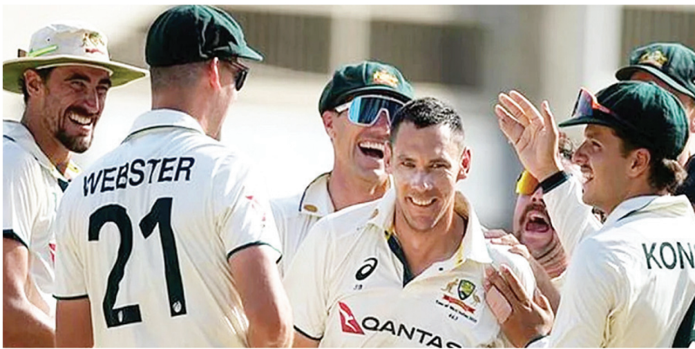
स्कॉट बोलेड को मौका मिला तय है। इसके दो अन्य तेज गेंदबाज हेजलवुड और मिचेल स्टार्क होंगे। ब्रेंडन डोगेट के डेब्यू करने की संभावना बढ़ी क्रिकेट डॉट कॉम डॉट एयू के

नई दिल्ली, एजेंसी। इंग्लैंड और ऑस्ट्रेलिया के बीच 5 मैचों की एंशज टेस्ट सीरीज 21 नवंबर से पर्थ में खेला जाएगा। इससे पहले ऑस्ट्रेलिया को बुधवार (12 नवंबर) को अच्छी और बुरी खबरें मिलीं। दिग्गज तेज गेंदबाज जोश हेजलवुड पहले टेस्ट में खेलने के लिए फिट हो गए हैं, लेकिन सीन एबट चोटिल होकर बाहर हो गए हैं। एबट का चोटिल होना इसलिए भी ऑस्ट्रेलिया के लिए झटका है क्योंकि कप्तान पैट कमिंस चोटिल होने के कारण पहले से ही बाहर है। शेफील्ड शिल्ड टूर्नामेंट में विकटोरिया के खिलाफ न्यू साउथ वेल्स के लिए खेलते हुए हेजलवुड और एबट को हेमरिंग में दिक्कत हुई। दोनों को स्कैन के लिए भेजा गया। ऑस्ट्रेलिया को हेजलवुड के फिट होने की राहत भरी खबर मिली, लेकिन एबट के बाहर होने को लेकर बुरी खबर आ गई। हालांकि, एबट का पर्थ में खेलना मुश्किल था। कमिंस की जगह ऑस्ट्रेलिया की प्लेइंग 11 में