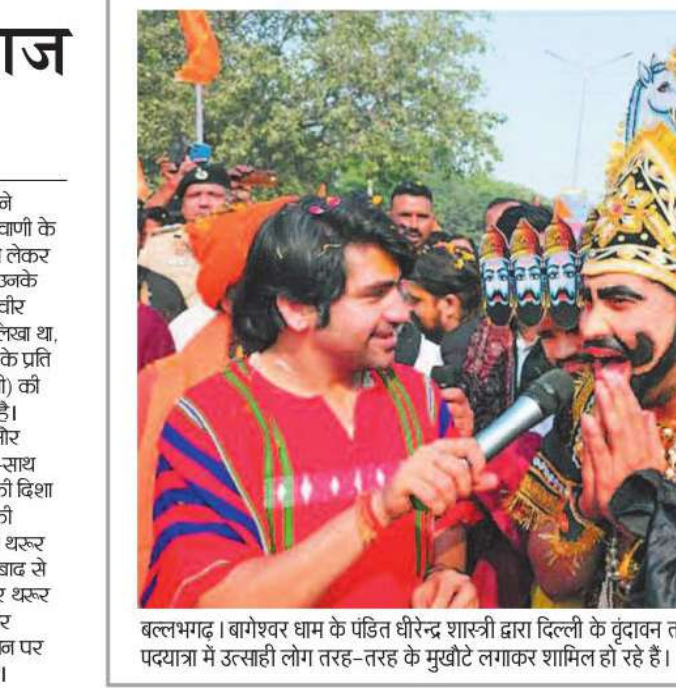
बलरामगढ़। बागेश्वर धाम के पंडित धीरेन्द्र शास्त्री द्वारा दिल्ली के वृंदावन तक निकाली जा रही रमानत हिंदु एकता पदयात्रा में उत्सही लोग तरह-तरह के मुखौटे लगाकर शामिल हो रहे हैं।