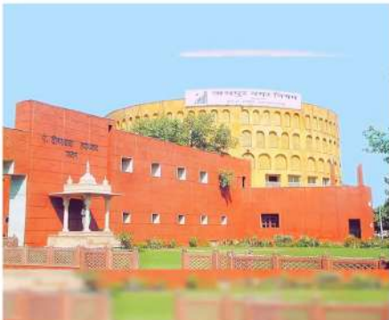
कर पाएंगे और गंदगी, सीवर, टूटी-फूटी सड़कों एवं अतिक्रमण की समस्या बढ़ सकती है।

जयपुर (रॉयल पत्रिका)। नगर निगम जयपुर ग्रेटर और हेरिटेज में शुक्रवार 8 नवंबर को पार्श्वों का शासन समाप्त हो गया यानी पार्श्वों एवं महापौर का 5 वर्षीय कार्यकाल समाप्त हो गया। नगर निगम में जनता का काम अब नगर निगम के अधिकारी एवं कर्मचारियों के द्वारा किया जाएगा। बिना पार्श्वों के जयपुर शहर के वार्डों में सफाई, सीवर, सड़क, मरम्मत एवं गंदी नालियों का काम कैसे होगा आने वाला समय बताएगा। वैसे माना जा रहा है कि नगर निगम के कार्यों पर पार्श्वों के नहीं होने का ज्यादा असर नहीं पड़ेगा क्योंकि नगर निगम में सक्षम अधिकारी हैं जो पार्श्वों की राजनीति के सामने दबाव में रहते थे, जबकि अब आसानी से कार्य करवा सकेगें। वैसे पार्श्व दत्त जनता के छोटे-छोटे कार्य जैसे राशन कार्ड संशोधन, मूल निवास प्रमाण पत्र, आरटीई आवेदन और पुलिस सत्यापन आदि करवाने में मदद करते थे। लेकिन अब जनता को मुश्किलों का सामना करना पड़ सकता है।