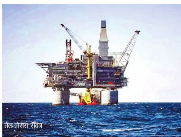
तेल प्रोसेसिंग स्थल