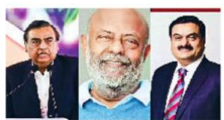
मुकेश अंबानी, शिव नादर और गौतम

दान किया है। वहीं 68 वर्षीय मुकेश अंबानी और उनका परिवार 626 करोड़ रुपए के योगदान के साथ दूसरे स्थान पर रहे। उनका परोपकार शिक्षा, ग्रामीण परिवर्तन, स्वास्थ्य, महिला सशक्तिकरण और विरासत संरक्षण तक फैला है। इस लिस्ट में कुल 191