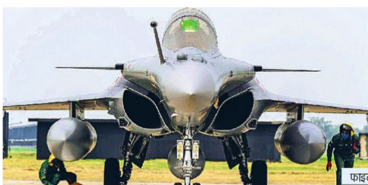
टीम की रिहर्सल जारी

दृज फॉर्मेशन के बाद स्वदेशी फाइटर जेट की पहली उड़ान होगी। फ्लाई-पास्ट में 75 लड़ाकू विमान हिस्सा लेंगे