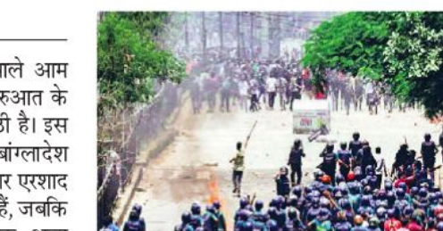
ढाका की सड़क हुई हिंसा