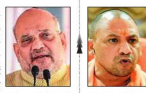
हुर कहा कि वह तभी (पीपू, टपू और अपू) बंदर न सच देखते हैं, न सुनते हैं, न बोलते हैं। उन्हें प्लेडिज सरकार का विकास दिखाई नहीं देता। उन्होंने कहा कि राजद साध है और कांग्रेस रामझोही, देशझोही और मां जानकी के विरोधी है। यह लोग सनातन परंपरा को कमजोर करना चाहते हैं।

केंद्रीय गृह मंत्री अमित शाह ने बिहार के शिवहर में महागठबंधन पर जमकर निशाना साधा। उन्होंने कहा, 14 नवंबर को राहुल और लालू की पार्टियां पूरी तरह खत्म हो जाएंगी। यहां एक बार फिर प्लेडिज की सरकार बनने का रईहा है। महागठबंधन के पास न तो कोई नेता है और न ही कोई साफ पॉलिसी। उन्हें यह भी नहीं पता कि कौन किस सीट से चुनाव लड़ रहा है। इस बीच, प्लेडिज की सभी पांच पार्टियां पांडवों की तरह एकजुट होकर बिहार की सभी 243 सीटों पर एक साथ चुनाव लड़ रही हैं। शाह ने कांग्रेस एमपी राहुल गांधी पर छठ वर्ष का अपमान करने का भी आरोप लगाया और कहा कि इस बार मोदी के साथ-साथ आपने छठी मैया का भी अपमान किया है।