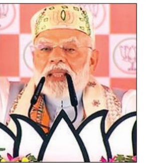
वह कभी नहीं जाते हैं। भगवान राम से अगर तकलीफ है तो निषाद राज जी, सबरी माता और वाल्मिकी जी के मंदिर में ही माथा टेक कर आ

जाति आधारित वोटिंग के लिए चर्चित रहे बिहार में विधानसभा चुनाव के पहले चरण के मतदान से तीन दिन पहले सहरसा में जनसभा को संबोधित करते हुए प्रधानमंत्री नरेंद्र मोदी ने कांग्रेस के नंबर-1 नेता राहुल गांधी को सनातन धर्म के अपमान पर घेरा। उन्होंने छठ से लेकर अयोध्या तक की चर्चा की। राहुल गांधी के बेगूसराय में मछली मारने की खबरों से जोड़ते हुए पीएम मोदी ने कहा कि अयोध्या में निषाद राज का मंदिर बना है। वहां