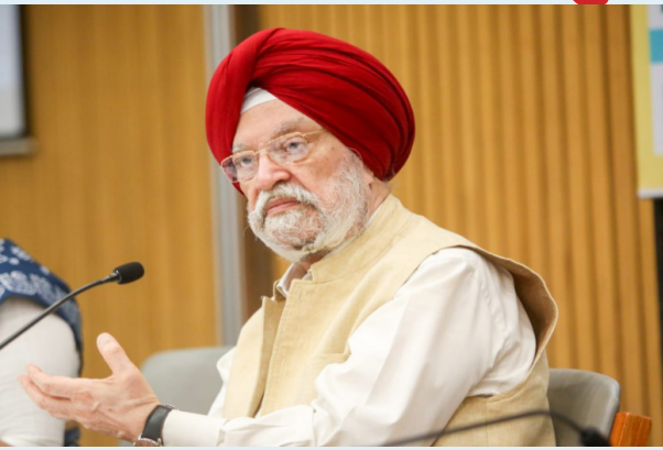
हुए वीडियो में बताया गया है कि मिशन का उद्देश्य देश भर में 20 हजार ग्राउंड लाइन किलोमीटर से अधिक की मैपिंग करना है।

उन्होंने मिशन की प्रगति को लेकर जानकारी देते हुए बताया कि अभी तक कुल 8000 ग्राउंड-लाइन किलोमीटर का सर्वेक्षण किया जा