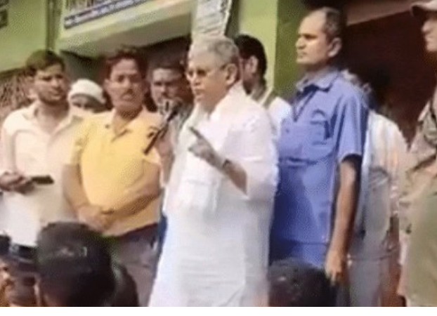
जदयू नेता और केंद्रीय मंत्री गरीबों को वोट उठाने के लिए विपक्ष द्वारा इसे वापरल किया गया है। जदयू नेताओं का कहना है कि विपक्ष विकास के मुद्दों से भटक गया है और चुनाव से पहले जानबूझकर भ्रम फैलाने की कोशिश कर रहा है।

नई दिल्ली/पटना। बिहार में विधानसभा चुनाव के पहले चरण के मतदान से ठीक पहले सियासत में गरमी और तेज हो गई है। मंगलवार शाम 5 बजे पहले फेज की सीटों पर चुनाव प्रचार थम गया। इस चरण में सभी प्रमुख दलों के नेताओं ने अपनी पूरी ताकत झोंकी दी थी। लेकिन प्रचार खत्म होने से कुछ घंटे पहले ही राज्य की राजनीति में बड़ा विवाद उस वक्त खड़ा हो गया जब केंद्रीय मंत्री और जदयू के वरिष्ठ नेता राजीव रंजन उर्फ ललन सिंह के खिलाफ आचार संहिता उल्लंघन का मामला दर्ज कर लिया गया।