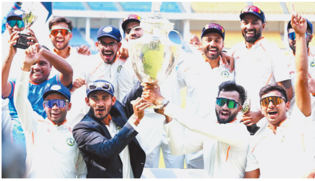
रणजी ट्रॉफी 2025: