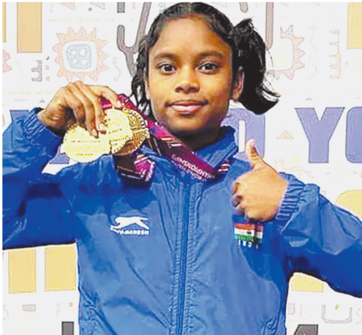
यूथ एशियन गेम्स:

कैमरा मैड्रिड के विंगर पर गया। उन्हें कुछ कड़े शब्दों का इस्तेमाल करते हुए देखा गया, हालांकि उनका इशारा किसी खास खिलाड़ी की ओर नहीं था। लेकिन इस घटना का वीडियो सोशल मीडिया पर वायरल हो रहा है। वीडियो में विनिसियस चिल्लाते हुए नजर आ रहे हैं। एल क्लासिको में ऐसा अक्सर देखने को मिलता है।