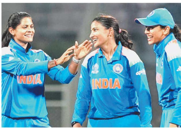
ही सेमीफाइनल में पहुंच चुकी है, जहां उसका सामना 30 अक्टूबर को ऑस्ट्रेलिया से होना है। दूसरी ओर बांग्लादेश टीम सेमीफाइनल की रेस से बाहर हो चुकी थी। इस मुकाबले में भारतीय टीम ने अपनी

दोनों टीमों के बीच यह मुकाबला नवी मुंबई के डीवाई पाटिल स्पोर्ट्स एकेडमी में खेला जा रहा था। मुकाबले में भारतीय टीम टॉस जीतकर पहले गेंदबाजी कर रही थी। बारिश के चलते मुकाबला 43-43 ओवर्स का कर दिया गया। बाद में और भी ओवर कम किए गए। भारतीय टीम पहले