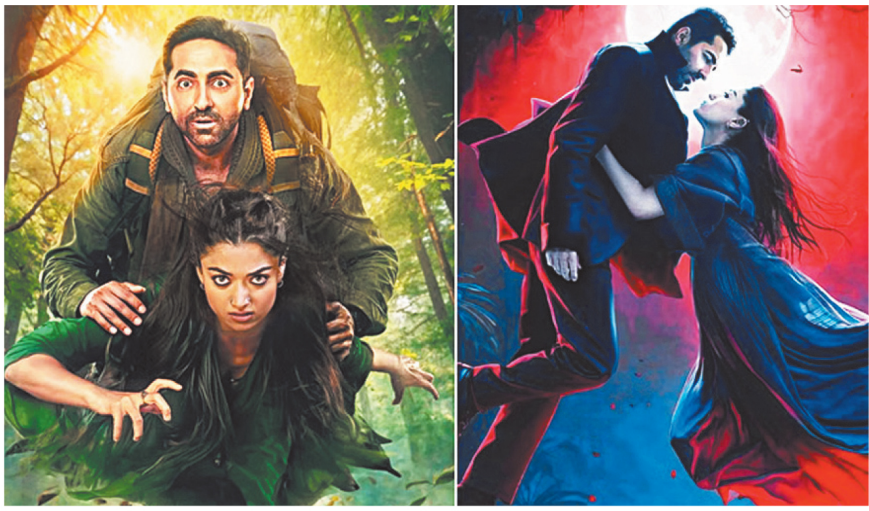
ट्रेलर से पहले मेकर्स ने जारी किया 'थामा' का नया पोस्टर