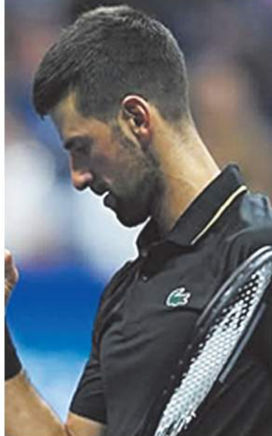
सबसे महत्वपूर्ण टूर्नामेंट हैं। नोवाक जोकोविच ने कहा, मैं अपने टेनिस के स्तर से खुश हूँ।

न्यूयॉर्क, एजेंसी। यूपएस ओपन के सेमीफाइनल में नोवाक जोकोविच को कार्लोस अल्काराज के खिलाफ शिकस्त झेलनी पड़ी, जिसके बाद सर्बियाई खिलाड़ी ने संन्यास की अटकलों को खारिज कर दिया। जोकोविच ने पुष्टि की है कि वह अगले साल एक पूर्ण ग्रैंड स्लैम सीजन खेलना चाहते हैं। 22 वर्षीय स्पेनिश खिलाड़ी कार्लोस अल्काराज ने 38 वर्षीय सर्बियाई खिलाड़ी को 6-4, 7-6(4), 6-2 से शिकस्त देकर अपने सातवें और न्यूयॉर्क में दूसरे मेजर फाइनल में प्रवेश किया है। आर्थर एश स्ट्रेटियम में करीब 2 घंटे 25 मिनट तक चले इस रोमांचक मुकाबले में कार्लोस अल्काराज ने इस साल के ऑस्ट्रेलियन ओपन और 2024 पेरिस ओलंपिक में जोकोविच से मिली हार का बदला लिया। सर्बियाई खिलाड़ी नोवाक जोकोविच ने कहा, मैं अब भी ग्रैंड स्लैम खेलना चाहता हूँ। मैं अगले साल पूरा ग्रैंड स्लैम सीजन खेलना चाहता हूँ। देखते हैं कि ऐसा होता है या नहीं। लेकिन स्लैम तो स्लैम होते हैं। यह किसी भी अन्य टूर्नामेंट से अलग है। ये हमारे खेल के स्तंभ हैं। यह हमारे