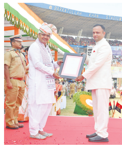
होम कार्यक्रम में भी शिरकत की थी।