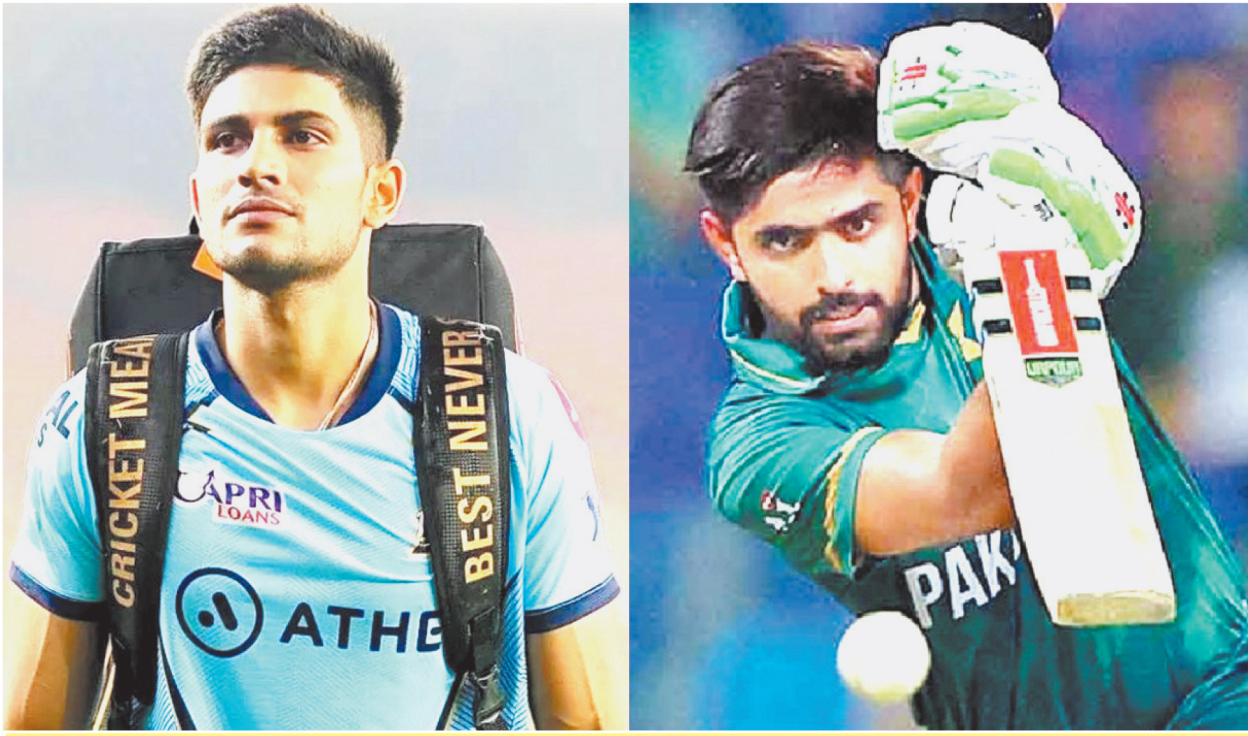
शुभमन गिल से हार गए बाबर आजम

दिग्गज टेनिस खिलाड़ी वीनस विलियम्स जल्द ही 'बाबी डॉल' के रूप में नजर आएंगी। इस गुड्डिया निर्माता कंपनी ने प्रेरणादायी महिलाओं की अपनी सीरीज में वीनस को लेकर 'बाबी डॉल' बनाई है जिसे शुक्रवार को जारी किया जाएगा। इस गुड्डिया को उसी तरह की पोशाक पहनाई गई है जो वीनस ने 2007 में विंबलडन चैंपियन बनने के दौरान पहनी थी। यह वही वर्ण था जब पहली बार किसी ग्रैंड स्लैम टूर्नामेंट में महिलाओं को पुरुषों के बाबर पुरस्कार राशि मिली थी। इस गुड्डिया की खुदरा कीमत 38 डॉलर बताई गई है, जिसमें वीनस पूरी तरह सफेद पोशाक में होंगी। उनके गले में हरे रंग का रत्न का हार, कलाई का बैंड हाथों में रैकेट और टेनिस बॉल होंगी।