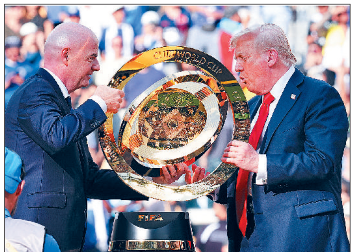
अमेरिकी राष्ट्रपति डोनाल्ड ट्रंप पहुंचे मुकाबला देखने