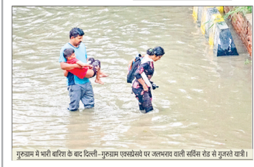
गुरुग्राम में भारी बारिश के बाद दिल्ली-गुरुग्राम एक्सप्रेसवे पर जलभराव वाली सर्विस रोड से गुजरते यात्री।