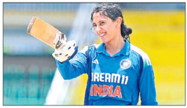
एजेसी ॥ दुबई

भारत की उप कप्तान स्मृति मंधाना मंगलवार को अंतरराष्ट्रीय क्रिकेट परिषद (आईसीसी) की एकदिवसीय बल्लेबाजी रैंकिंग में 2019 के बाद पहली बार शीर्ष स्थान पर पहुंच गयीं। दक्षिण अफ्रीका की कप्तान लॉरा वोलवार्ट ने ताजा अपडेट में 19 रैंकिंग अंक गंवाये जिसका फायदा भारतीय बल्लेबाज को मिला। मंधाना के कुल 727 रैंकिंग अंक हैं। उनके बाद इंग्लैंड की कप्तान नताली साइव-ब्रंट 719 अंकों के साथ दूसरे स्थान पर हैं।