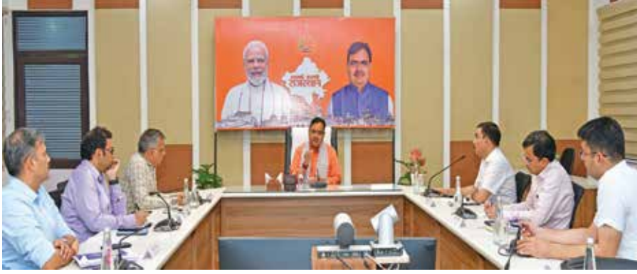
आयाम मिले। दिखेगी 'राइजिंग' राजस्थान की प्रगति, रखेंगे 2026 का विजन —

जयपुर, (रॉयल पत्रिका)। मुख्यमंत्री भजनलाल शर्मा ने कहा कि वर्ष 2047 तक विकसित राजस्थान के संकल्प को साकार करने में राइजिंग राजस्थान ग्लोबल इन्वेस्टमेंट समिट की अहम भूमिका है। पिछले वर्ष हुए इस आयोजन ने निवेश के क्षेत्र में नई ऊंचाइयों को छुआ और राजस्थान प्रमुख निवेश केन्द्र के रूप में उभरा है। इसी कड़ी में जयपुर में 11 व 12 दिसम्बर को आयोजित होने वाली राइजिंग राजस्थान पार्टनरशिप कॉन्क्लेव-2025 प्रदेश की राष्ट्रीय एवं अन्तर्राष्ट्रीय स्तर पर निवेश साझेदारी को और मजबूत करेगी।