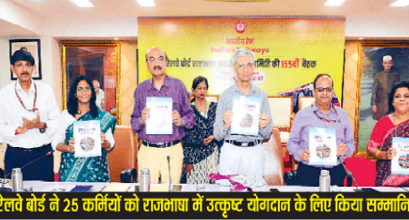
रेलवे बोर्ड ने 25 कर्मियों को राजभाषा में उत्कृष्ट योगदान के लिए किया सम्मानित

हरिद्वीप ब्यूरो। नई दिल्ली। रेल मंत्रालय ने रेलवे बोर्ड राजभाषा कार्यान्वयन समिति की 155 वीं बैठक का आयोजन किया गया। इस बैठक की अध्यक्षता सचिव (परिचालन व व्यावसायिक विकास) हितेंद्र अहोवाल ने की। उन्होंने बैठक में राजभाषा पत्रिका रेल राजभाषा के 141 वें अंक का विमोचन किया। साथ ही रेलवे बोर्ड (भारतीय रेल - क्षेत्रीय भाषाओं का मेल) पुस्तिका का भी विमोचन किया। अपने अध्यक्षीय संबोधन में उन्होंने रेलवे बोर्ड के राजभाषा विदेशालय द्वारा