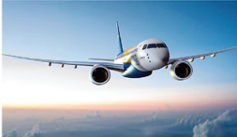
भारत के रक्षा क्षेत्र में एंबरेयर की अच्छी-खासी उपस्थिति- बीते साल ही एंबरेयर डिफेंस एंड सिस्कोरिटीज ने भारतीय कंपनी महिंद्रा डिफेंस सिस्टम के साथ समझौता किया है। दोनों कंपनियाँ मिलकर भारतीय

2 विमानों को भारत में बेचने की कोशिश कर रही है, जो 146 सीटों वाला विमान है। नेटो ने बताया कि एंबरेयर ने भारत में विमानों के बाजार को देखते हुए एक अधिग्रहण टीम नियुक्त की है। साथ ही कंपनी ने सरकार से संपर्क के लिए, संचार, इंजीनियरिंग, सेल्स और मार्केटिंग के लिए भी टीमों नियुक्त कर दी हैं। अभी भी भारत में एंबरेयर के 50 से ज्यादा विमान भारत में संचालित हो रहे हैं। ये विमान कमर्शियल, बिजनेस वर्ग के साथ ही रक्षा क्षेत्र में भी संचालित हैं। क्षेत्रीय विमानन कंपनी स्टार एयर के पास एंबरेयर विमान हैं। नेटो ने बताया कि उनकी कंपनी भारत में ही मॉडिंग के लिए अपना केंद्र स्थापित करने पर भी विचार कर रही है, लेकिन ये विमानों की बिक्री पर निर्भर करेगा।