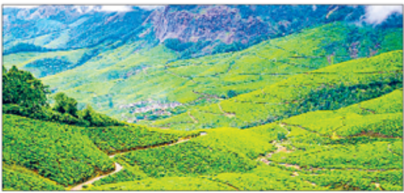
कोलुम्बुमालाई तमिलनाडु के चेन्नई जिले में स्थित एक छोटा सा गाँव है। कोलुम्बुमालाई दुनिया में सबसे ऊंचे चाय बागानों के लिए प्रसिद्ध एक छोटा सा गाँव है, जो चाय को एक विशिष्ट स्वाद देता है। प्रसिद्ध चाय कारखानों में से एक जहां वे पारंपरिक तरीके से चाय को संभालते करते हैं।