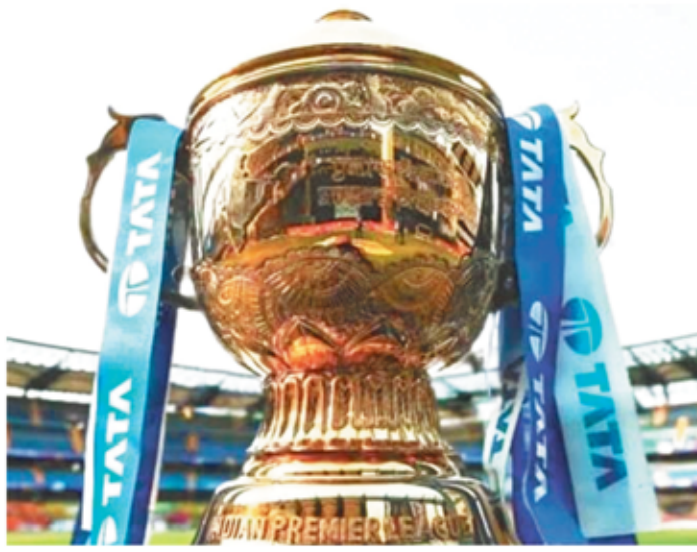
भारतीय सेना के लिए वीसीसीआई कट रत्न स्पेशल इवेंट