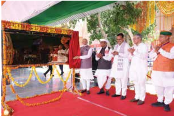
का आभार जताया।

जयपुर, (रॉयल पत्रिका)। प्रधानमंत्री नरेन्द्र मोदी ने गुरुवार को बीकानेर स्थित देशनोक, पलाना में 26 हजार करोड़ रुपये से अधिक लागत की विकास परियोजनाओं का उद्घाटन और शिलान्यास कर उन्हें राष्ट्र को समर्पित किया। इस दौरान उन्होंने अमृत भारत स्टेशन योजना के अंतर्गत 103 पुनर्विकसित रेलवे स्टेशनों का उद्घाटन किया। इससे पहले राज्यपाल हरिभाऊ बागडे ने प्रधानमंत्री की अगुआई करते हुए उनका भावकृभरा अभिनंदन किया। बाद में राज्यपाल कार्यक्रम स्थल पर भी प्रधानमंत्री मोदी के साथ मौजूद रहे। उन्होंने राजस्थान को विकास कार्यों और जन कल्याण योजनाओं की दी गई सौगात के लिए प्रधानमंत्री मोदी का आभार जताया।