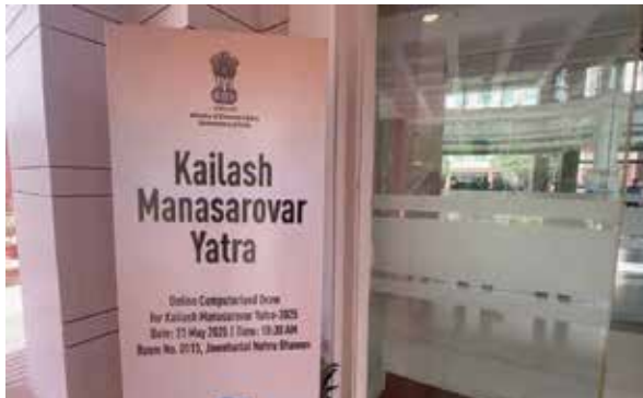
सरकार द्वारा उठाए गए कदमों पर प्रकाश डाला। उन्होंने यात्रियों से यात्रा को जिम्मेदारी, विनम्रता और सजगता के साथ करने की अपील की। उन्होंने पर्यावरण की पवित्रता को बनाए रखने का भी आग्रह किया। उल्लेखनीय है कि कोरोना महामारी के कारण 2020 में यात्रा

प्राप्त की जा सकती है। इस वर्ष 5561 आवेदकों ने ऑनलाइन पंजीकरण कराया। इनमें 4024 पुरुष और 1537 महिलाएं थीं। कुल 750 यात्रियों का चयन किया गया है। इनमें प्रति बैच 2 स्थानीय अधिकारी भी होंगे। यात्रा में 5 बैच 50 यात्रियों के साथ लिपुलेख मार्ग से और 10 बैच 50 यात्रियों के साथ नाथू ला मार्ग से यात्रा करेंगे। दोनों मार्ग अब पूरी तरह से मोटर योग्य हैं और इनमें बहुत कम ट्रेकिंग करनी होगी।