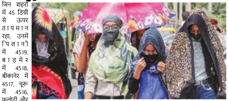
लूणकरणसर में 45.12 डिग्री तापमान रहा। जयपुर में दिन का तापमान 43.18 डिग्री सेल्सियस तक पहुंचा। राज्य के अन्य शहरों जैसलमेर (44.17), अलवर (44.11), कोटा (44), करौली और हनुमानगढ़ (43.16), चित्तौड़गढ़ (43.15), जोधपुर (43.12) और झुंझुनूं में (43.11) डिग्री सेल्सियस तापमान के साथ लोग झुलसते रहे। दिनभर चिलचिलाती धूप के बाद दोपहर बाद कुछ जिलों में तेज हवाओं और बारिश से राहत मिली। राज्य में बीते 24 घंटे में सर्वाधिक वर्षा बिजोलिया (जिला भीलवाड़ा) में 18.10 मिमी दर्ज की गई। साथ ही चित्तौड़गढ़ और प्रतापगढ़ में भी जोरदार बारिश हुई। वहीं, उदयपुर, झालावाड़,

जयपुर। राजस्थान में भीषण गर्मी का प्रकोप लगातार बढ़ता जा रहा है, जिससे आम जनजीवन बुरी तरह प्रभावित हो रहा है। राज्य के कई इलाकों में तापमान 45 डिग्री सेल्सियस से पार पहुंच गया है। मंगलवार को श्रीगंगानगर देश के सबसे गर्म स्थानों में शामिल रहा, जहां अधिकतम तापमान 46.3 डिग्री सेल्सियस दर्ज किया गया, जो सामान्य से 3.6 डिग्री अधिक है। राज्य के अन्य हिस्सों में भी दिन और रात के तापमान में तेजी से बढ़ोतरी देखी गई है। हालांकि उदयपुर संभाग के कुछ क्षेत्रों में हल्की बारिश होने से लोगों को थोड़ी राहत जरूर मिली। सिरोंही में न्यूनतम तापमान 23.6 डिग्री सेल्सियस रिकॉर्ड किया गया। मौसम विभाग के अनुसार आने वाले दिनों में गर्मी से राहत मिलने की संभावना कम ही है।