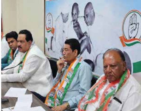
विस्तार का माध्यम बनेगी, बल्कि और सामाजिक न्याय की भावना को भी सुदृढ़ करेगी।

अखिल भारतीय कांग्रेस कमेटी (अल्पसंख्यक विभाग) द्वारा जारी दिशा-निर्देशों के अंतर्गत एक संगठित अभियान की शुरुआत की गई है। इस अभियान का उद्देश्य गुजरात राज्य में अल्पसंख्यक विभाग के संगठनात्मक ढांचे को जिला, संभाग, ब्लॉक, वार्ड तथा ग्राम स्तर तक मजबूती प्रदान करना है। कांग्रेस पार्टी का यह संकल्प है कि प्रत्येक स्तर पर समुदाय की भागीदारी सुनिश्चित की जाए और उनकी समस्याओं, अधिकारों एवं भागीदारी को प्राथमिकता के साथ संबोधित किया जाए। यह रणनीति न केवल संगठनात्मक