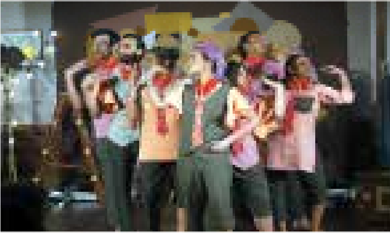
Group photo of performers on a stage during the Mahindra Excellence in Theatre Awards ceremony.

20 भारतीय राज्यों से 32 मराठी और बॉलीवुड में 367 नाटकों में से चुने गए श्रेष्ठ नाटक