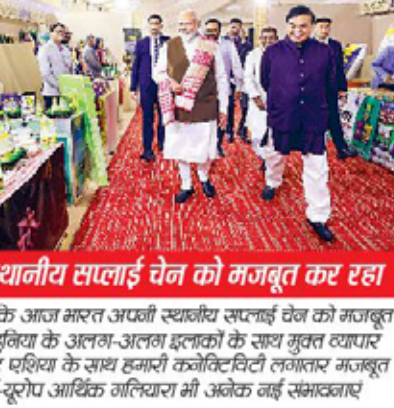
गुवाहाटी में बोले पीएम मोदी

प्रधानमंत्री नरेंद्र मोदी ने मंगलवार को असम की राजधानी गुवाहाटी के खानापाड़ा में दो दिनों के एडवांटेज असम 2.0 निवेश और बुनियादी ढांचा शिखर सम्मेलन 2025 का उद्घाटन किया। पीएम मोदी ने कहा कि जब से भाजपा सरकार आई है तब से असम की अर्थव्यवस्था का मूल्य दोगुना होकर 6 लाख करोड़ रहा गया है। यह डबल इंजन सरकार और डबल इंजन की स्पीड का असर है। पूर्वी भारत और नॉर्थ-ईस्ट की पवित्र धरती पर आज नए भविष्य की शुरुआत हो रही है। ये एडवांटेज पूरी दुनिया के असम की प्रगति से जोड़ने का महाअभियान है।