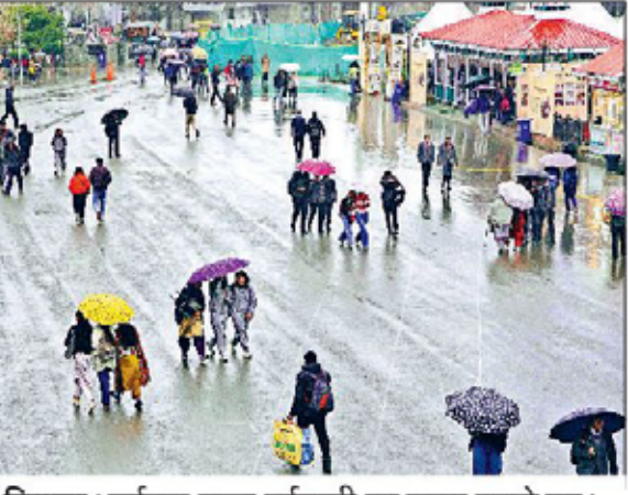
शिमला। पर्यटक ताजा बर्फबारी का लुफ्त उठाते हुए।