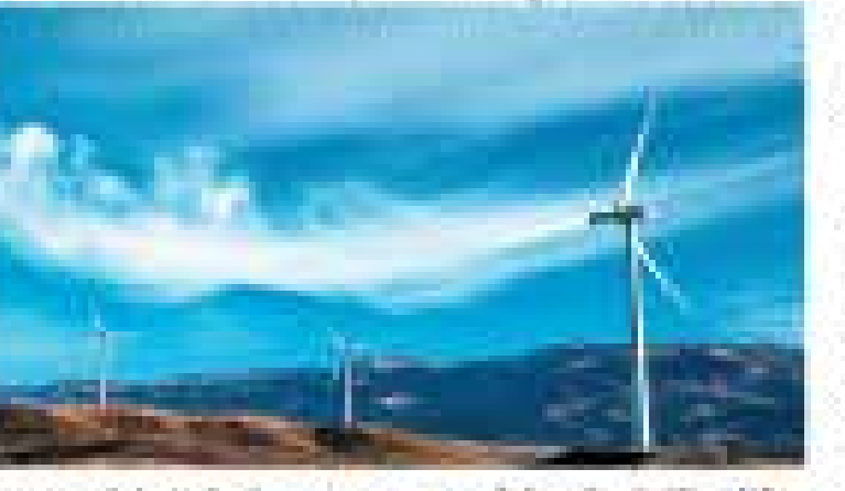
Image of a wind turbine in a field, representing renewable energy.

मुंबई, एशियाई बाजारों में भारतीय ब्रांडों का सबसे बड़ा प्रतिस्पर्धी ब्रांड है, अपने नाम से रियलमी पी3 प्रो 5जी और रियलमी पी3 एक्स 5जी का लॉन्च के साथ ही रियलमी ब्रांड का प्रतिस्पर्धी ब्रांड बनने में सफल हो चुका है।