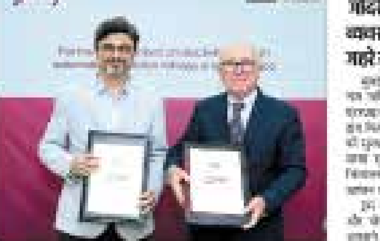
Image of two men holding certificates, representing an award ceremony.