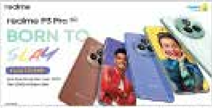
Realme Pro 5G and Pro 5G Pro smartphones are shown with their respective branding and features highlighted.

मुंबई, एशियाई बाजारों में भारतीय ब्रांडों का सबसे बड़ा प्रतिस्पर्धी ब्रांड है, अपने नाम से रियलमी पी3 प्रो 5जी और रियलमी पी3 एक्स 5जी का लॉन्च के साथ ही रियलमी ब्रांड का प्रतिस्पर्धी ब्रांड बनने में सफल हो चुका है। रियलमी पी3 प्रो 5जी और रियलमी पी3 एक्स 5जी को लॉन्च कर रियलमी ब्रांड को एक नए स्तर पर ले जा रहा है। रियलमी पी3 प्रो 5जी को लॉन्च कर रियलमी ब्रांड को एक नए स्तर पर ले जा रहा है। रियलमी पी3 प्रो 5जी को लॉन्च कर रियलमी ब्रांड को एक नए स्तर पर ले जा रहा है।