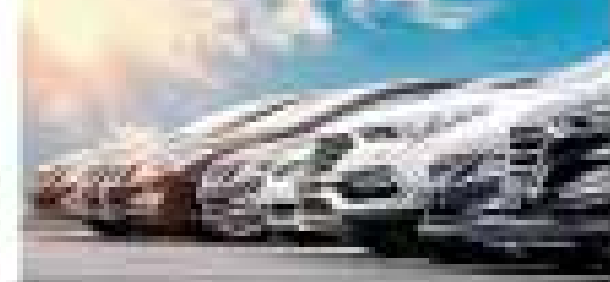
Image of a car on a road, representing a dealership.

66 प्रतिशत के मुताबिक सर्विस सेंटर ने ज्यादा पैसे खर्च गए