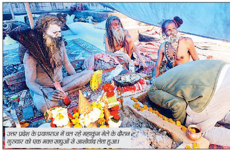
उत्तर प्रदेश के प्रयागराज में चल रहे महाकुंभ मेले के दौरान गुरुत्वार को एक भक्त तपुओ से आशीर्वाद लेता हुआ।