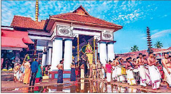
वैकुंठ मंदिर केरल के कोट्टायम में स्थित है और नवंबर के महीने में अपने वैकुंठ अष्टमी उमाराह के दौरान इस मंदिर का महत्व और बढ़ जाता है। इस मंदिर का निर्माण वर्ष 1594 में किया गया था। पौराणिक कथाओं के अनुसार इस मंदिर में जो शिवलिंग स्थापित है वह त्रेता युग में स्थापित की गई थी।