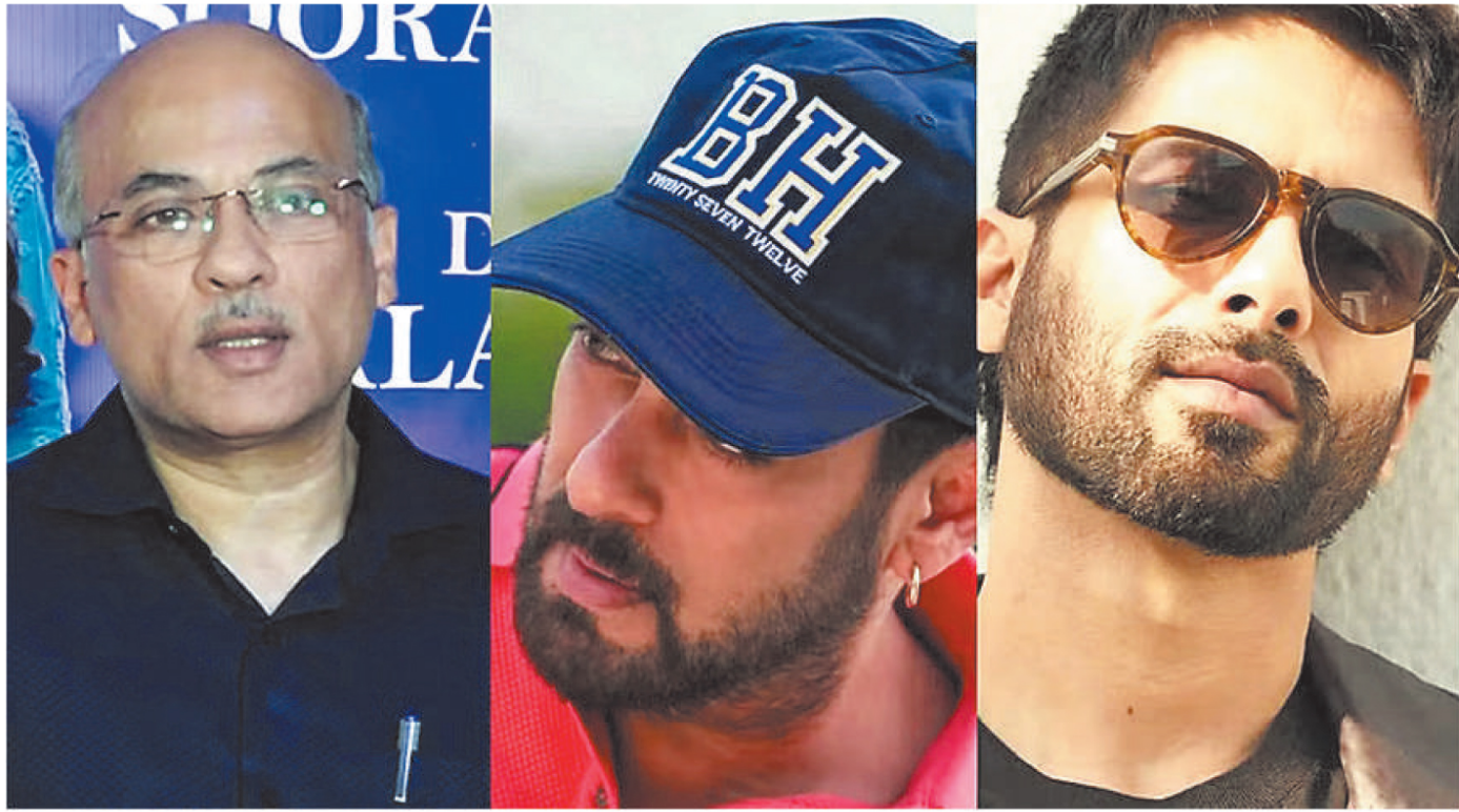
विवाह में सलमान की जगह शाहिद क्यों बने प्रेम...