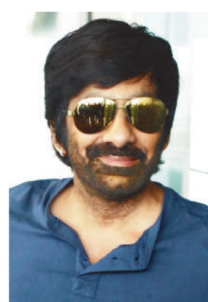
रवि तेजा की फिल्म पर आया अपडेट

मास महाराजा के नाम से मशहूर रवि तेजा जल्द ही नई फिल्म मास जतारा में नजर आने वाले हैं। यह एक एक्शन-कॉमेडी फिल्म है, जिसका निर्देशन भानु भोगवरा ने किया है। हाल ही में फिल्म की झलकियां साझा की गई थी, जिसमें रवि तेजा के पुराने अंदाज की झलक देखने को मिली। इसे देखने के बाद उनके फैस के बीच फिल्म को लेकर उत्साह और बढ़ गया है। हालांकि, फिल्म की रिलीज डेट अभी तक घोषित नहीं की गई है, लेकिन खबरें हैं कि इसे 2025 की गर्मियों के महीने में रिलीज किया जा सकता है।