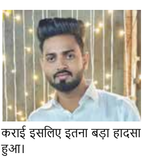
कराई इसलिए इतना बड़ा हादसा हुआ।

मांग की है। मकान मालिक की लापरवाही आई सामने इस हादसे में मकान मालिक की लापरवाही सामने आई है स्थानीय लोगों ने बताया कि हादसे के आगे ही दिन मकान मालिक मदद करने के बजाय बिजली का बिल और किराया मांगने आ गया। मकान बहुत खस्ता हाल था उसके बावजूद उसने इसकी मरम्मत नहीं