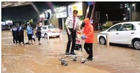
एयरपोर्ट पर पानी भरने के बाद परेशान यात्री।