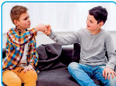
अगर तुम्हारी दोस्ती पर पड़ सकता है। यह कभी ना भूलो कि अपने दोस्त को मदद करना हमारा फर्ज है।

अगर तुम्हारा फ्रेंड किसी प्रॉब्लम में है तो तुम्हें उसकी हेल्प जरूर करनी चाहिए। जैसे कि तुम्हारा फ्रेंड बीमारी या किसी अन्य वजह से स्कूल नहीं जा पा रहा है, तुम रेग्युलर स्कूल जा रहे हो, तो तुम अपने फ्रेंड को क्लास में जो पढ़ाया गया है, उसे ब्रीफ करो, नोट्स व्हाट्स-एप कर दो। अगर दोस्त तुम्हारे घर के पास रहता है तो तुम उसके घर जाकर भी स्कूल में जो पढ़ाई हुई है, उसके बारे में जानकारी दे सकते हो। इसके अलावा अलग-अलग सिचुएशंस में जरूरत के अनुसार तुम अपने फ्रेंड की हेल्प कर सकते हो।