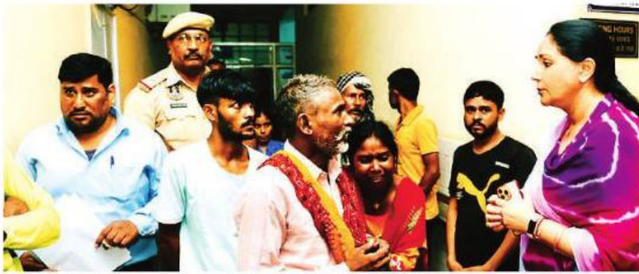
पीड़ित परिवार के सदस्यों से मिलती उपमुख्यमंत्री दिया कुमारी।

गुरुवार तड़के घटना की सूचना मिलते ही दिया कुमारी ने नगर निगम की टीमों को पंप और मशीनों के साथ घटनास्थल पर भिजवाया और पानी की निकासी के साथ-साथ बचाव व राहत कार्य शुरू करने के निर्देश दिए। उपमुख्यमंत्री के सख्त निर्देशों के बाद जिला प्रशासन के अधिकारी मौके पर पहुंचे। दिया कुमारी ने मुख्यमंत्री भजनलाल शर्मा का धन्यवाद ज्ञापित करते हुए कहा कि उन्होंने घटना की सूचना मिलते ही त्वरित कार्रवाई करते हुए पीड़ितों को आपदा राहत कोष से 4-4 लाख और मुख्यमंत्री सहायता