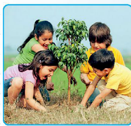
पर हमारी निर्भरता कम नहीं हुई है। हमने अपने दोस्त से लिया, दिया कुछ नहीं: प्रकृति ने हर स्थिति में मानव से अपनी दोस्ती निभाई है। उसने तरह-तरह के फल-फूल दिए हैं। लेकिन शावद हमारी ओर से दोस्ती में कमी रह गई है। हमने प्रकृति का ख्याल उस तरह नहीं रखा, जिस तरह प्रकृति हमारा रखती है। हमने अपनी दोस्त प्रकृति से सिर्फ लिया, दिया कुछ नहीं। तभी तो आज नदियां दूषित हैं, सूख रही हैं। समुद्र प्लास्टिक कचरे से भरे हैं। आज जगह-जगह कचरे के पहाड़ नजर आते हैं। दुर्गंध फैली रहती है। हवा में इतना प्रदूषण है कि सांस लेना मुश्किल हो गया है। हमारी पृथ्वी की मिट्टी रसायनों के अधिक प्रयोग से अपनी उर्वर क्षमता खो रही है।

सावन का महीना है। रिमझिम फुहारों के साथ हमें चारों तरफ हरियाली ही हरियाली दिखती है, मन प्रसन्न हो जाता है। कुछ ऐसी प्रसन्नता मिलती है, जैसे दोस्तों के साथ मिलती है। बच्चों, प्रकृति भी हमारी दोस्त है। लेकिन हम अपने स्कूल और पड़ोस के दोस्तों की चर्चा तो खूब करते हैं, लेकिन अपने बहुत ही करीबी दोस्त प्रकृति को भूलते रहते हैं, जबकि वह सृष्टि के जन्म से हमारी बहुत प्यारी, बहुत ही उपयोगी-महत्वपूर्ण दोस्त है। फ्रेंडशिप-डे करीब है। हम इस दोस्त को जरूर याद करें।